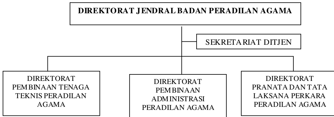
Gambar 9 Bagan Struktur Direktorat Jendral Badan Peradilan Agama