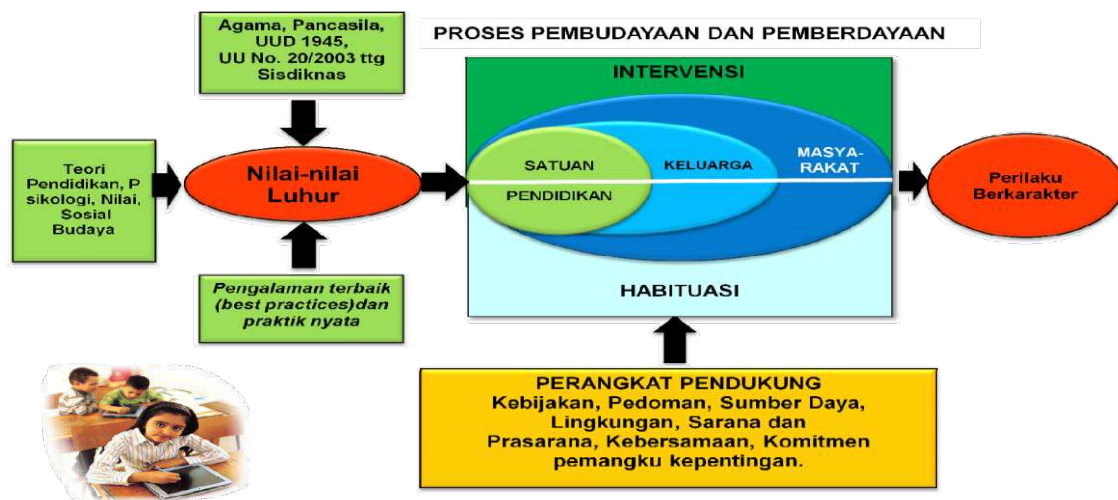
Gambar 1. Grand Design Pendidikan Karakter Kemdiknas (2010)

Dalam Grand Design Pendidikan Karakter Kemendiknas (2010), dinyatakan bahwa pendidikan karakter merupakan proses pembudayaan dan pemberdayaan peserta didik agar memiliki nilai-nilai luhur dan perilaku berkarakter yang dilakukan melalui tri pusat pendidikan, yaitu: pendidikan di keluarga, pendidikan di sekolah dan pendidikan di masyarakat. Secara visual, strategi pendidikan karakter di sekolah dilukiskan pada Gambar 1 berikut.