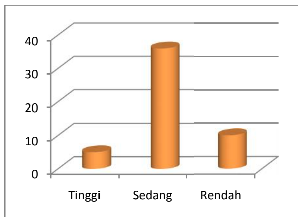
Diagram 2. Tingkat efikasi diri ( pretest ) remaja Pantu Asuhan Tuma'ninah Yasin

Dari diagram di atas, terlihat bahwa berdasarkan hasil pretest efikasi diri remaja Pantu Asuhan Tuma'ninah Yasin berada pada kategori sedang.