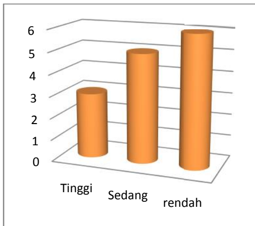
Diagram 1. Tingkat efikasi diri ( pretest ) remaja Panti Asuhan Budi Utomo

Agar lebih mudah dibaca, maka data di atas disajikan dalam diagram berikut: