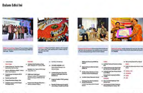
Gambar 5. Desain Terpilih

Dari hasil karya desain terpilih akan diaplikasikan pada art carton 260gr dengan laminating doff untuk cover dan art paper 150gr untuk halaman isi. Dengan ukuran 210 x 275 mm sebanyak 56 halaman termasuk cover . Turunan desain akan diaplikasikan pada poster, flyer , stiker, pulpen dan mug .