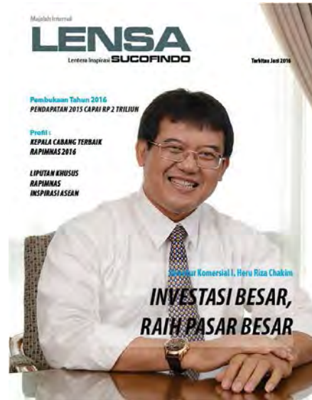
Gambar 3. Desain Terpilih

Setelah menentukan konsep yang akan dibuat dan proses mind mapping maka dibuatlah lima sketsa alternatif yaitu tema elegant , tema lingkaran, tema corner , tema light , dan tema simple . Menjelaskan prinsip desain pada lima sketsa alternatif serta menjelaskan layout dan image .