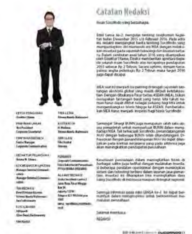
Gambar 4. Desain Terpilih

Bagian cover , gambar satu halaman penuh dan penggunaan sedikit elemen agar menciptakan kesan elegant dan sederhana. Bagian nameplate adalah mandatory element dari brief yang diberikan klien terletak di ujung kiri atas cover dan berwarna kontras dengan latar belakang. Pada latar belakang maincoverline terdapat bentuk persegi panjang berwarna putih sebagai latar belakang agar meningkatkan keterbacaan teks, bentuk persegi panjang ditransparansi agar tidak menghalangi main image .