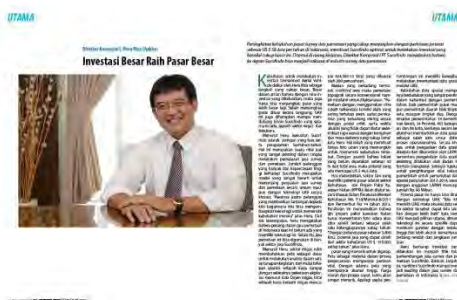
Gambar 6. Desain Terpilih

digunakan pada bodytext , runninghead dan nomor halaman, warna abu-abu digunakan judul. Bentuk persegi panjang berwarna biru dan putih dimaksudkan agar menjadi latar belakang coverline dan main coverline agar mempermudah keterbacaan teksnya. Warna pada bentuk persegi panjang dibuat transparan agar tidak menghalangi gambar. cenderung. Warna hitam digunakan untuk judul, caption, bodytext , running head dan nomor halaman, dan warna abu-abu digunakan sebagai latar belakang caption.