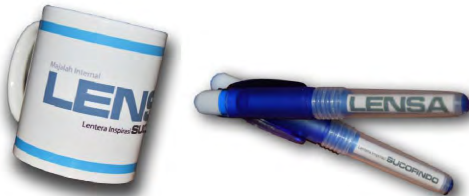
Gambar 7. Desain Turunan