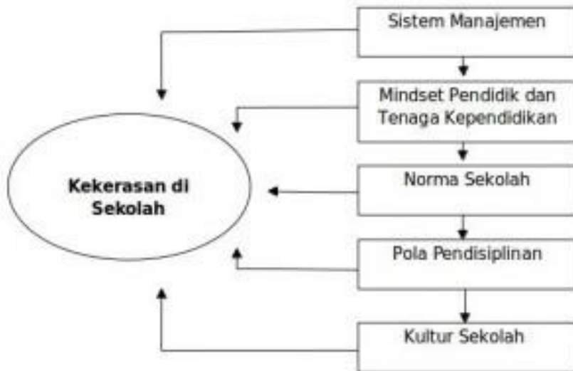
Grafik Faktor Pemicu Kekerasan di Sekolah

Beragam masalah munculnya kekerasan di sekolah dipicu oleh beragam faktor. Faktor dominan yang cukup berpengaruh meliputi; sistem manajemen, mindset pendidik dan tenaga kependidikan, norma sekolah, pola pendisiplinan serta kultur di sekolah.