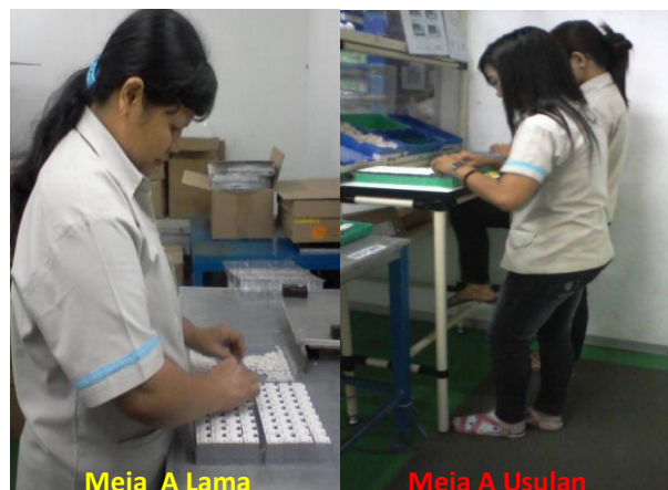
Gambar3 Perbandingan Meja A lama dan usulan

yaitu 87,2 cm atau dibulatkan menjadi 87 cm dengan tujuan untuk mempermudah pengerjaan. Dikarenakan pada proses 1 dan 2 membutuhkan ketelitian maka perlu ditambah 10 s/d 20 cm. Jadi tinggi meja A adalah 87 \text{ cm} + 10 \text{ cm} = 97 \text{ cm} . Untuk lebar meja digunakan persentil 95 dari jangkauan tangan (JT) yaitu 62,11 cm atau dibulatkan menjadi 62 cm. Panjang meja diukur dengan melihat panjang tray tempat meletakkan komponen. Pada proses 1 menggunakan 2 buah tray yang terdiri dari 2 jenis component, pada proses 2 digunakan 2 buah tray yang terdiri dari 1 jenis component dan 1 tray digunakan sebagai tempat meletakkan barang yang telah selesai diproses. Jadi ukuran panjang meja adalah 4 kali panjang tray, yaitu 4 \times 40 \text{ cm} = 160 \text{ cm} . Dinding pada meja digunakan sebagai tempat untuk meletakkan WI ( work intrusion ) atau cara kerja. Untuk membuat dinding meja maka digunakan persentil 95 dari tinggi mata berdiri (TMB) yaitu 149,35 cm dibulatkan menjadi 149 cm. Lebar dinding sesuai dengan lebar WI, yaitu 22 cm. Panjang dinding sama dengan panjang meja yaitu 160 cm. Berikut gambar perbandingan meja lama dan meja A usulan :