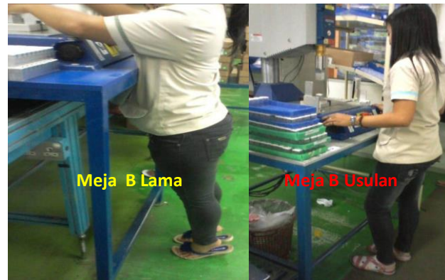
Gambar 4 Perbandingan Meja B Lama dan Meja B Usulan

digunakan ukuran panjang landasan mesin, yaitu 80 cm. Panjang meja menggunakan ukuran lebar landasan mesin ditambah 2 kali ukuran lebar tray. Yaitu 50 \text{ cm} + 50 \text{ cm} = 100 \text{ cm} . Berikut gambar meja yang lama dan meja usulan..