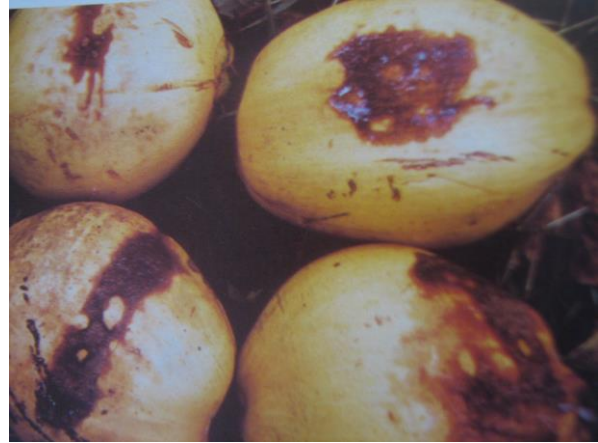
Gambar 6. Gejala serangan penyakit gugur buah

Jika dibelah sabut buah yang gugur berwarna coklat merah jambu sampai coklat tua, tempurung menjadi coklat, kulit biji menjadi kelabu dan berlendir sedangkan daging buah tidak menebal tetap lunak dan jernih.