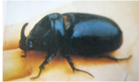
Gambar 1. Imago Oryctes rhinoceros

Dapat dicegah khususnya pada saat peremajaan dengan penanaman tanaman sela dan penutup tanah serta pembuatan perangkap