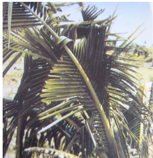
Gambar 4. Daun terserang Oryctes sp

Kumbang Callimerus arcufer merupakan predator hama Artona .