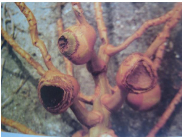
Gambar 3. Buah muda terserang Sexava sp