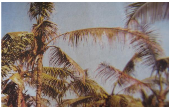
Gambar 5. Gejala serangan penyakit busuk pucuk

Patogen penyebab PGB adalah Phytophthora sp gejala serangan penyakit ini ditandai oleh bercak-bercak berwarna coklat kehitaman dibagian luar buah, bila bercak mencapai kelopak buah akan gugur. Jika serangan tidak sampai pada kelopak buah, maka buah masih dapat bertahan dan tidak gugur hingga buah siap dipanen. Serangan pada buah yang tidak gugur menyebabkan pembentukan daging buah tidak normal dan berlendir, jika buah dibelah dan dibiarkan pada suhu ruangan akan ditumbuhi miselia/bewang-bewang yang berwarna putih. Umur buah yang paling banyak diserang adalah buah yang berumur 4-6 Bulan dan umumnya buah ini akan gugur (Bennet et al. , 1986).