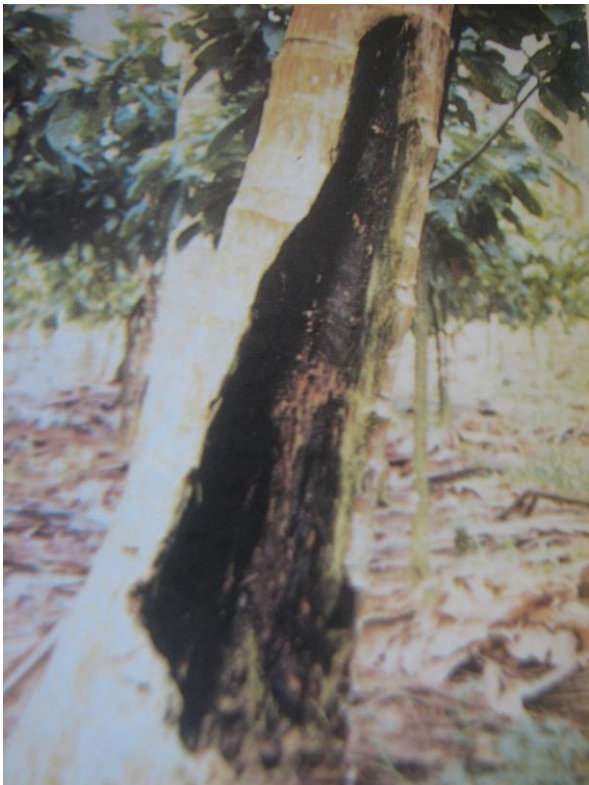
Gambar 7. Gejala serangan penyakit ( Stem Bleeding )

Pencegahan dengan menaikkan pH tanah yaitu memberikan pupuk KCl dan dengan fungisida Dithane M-48 bahkan dengan mengeruk bagian yang terserang dan dioleskan dengan fungisida. Kerusakan batang ditandai dengan mengeluarkan cairan berwarna merah.