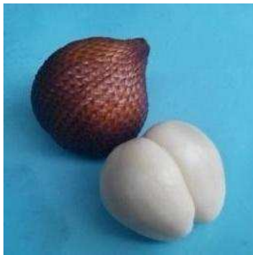
Gambar 1. Bentuk buah salak varian gula pasir.

Ukuran bijinya relatif kecil. Salah satu kelebihan dari buah salak varian ini adalah rasanya yang sangat manis seperti gula pasir, sehingga dinamakan salak varian gula pasir (Redaksi Agromedia Pustaka, 2009).