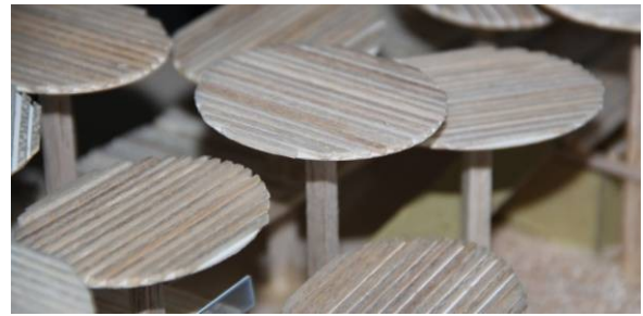
Gambar 6. Bentuk dasar atap

Bentuk kolom penahan atap dirancang untuk tidak terlihat masif agar kolom tidak menghadirkan kesan artifisial yang kuat tetapi tetap selaras dengan lingkungan sekitarnya (gambar 9). Konsep ini diaplikasikan dengan membentuk kolom yang terdiri dari kolom-kolom kecil yang diikat secara bersilangan dan menyisakan lubang-lubang pada kolom. Hal ini dilakukan agar kolom yang cukup besar ukurannya mempunyai akses visual terhadap lingkungan sekitarnya sehingga tidak terlihat kesan masif yang mengakibatkan hilangnya suasana ruang luar yang ingin diciptakan.