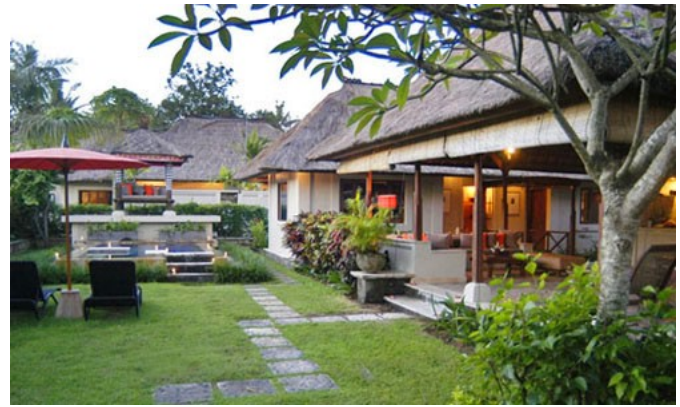
Gambar 3. Natah dalam rumah Bali kontemporer

Selain dengan pengolahan bayangan sebagai ruang di dalam arsitektur, elemen lansekap merupakan hal penting lain di dalam eksplorasi rancangan untuk mendapatkan keselarasan antara ruang luar dan ruang dalam. Dalam bukunya New Vernacular Architecture , Vicky Richardson menyatakan