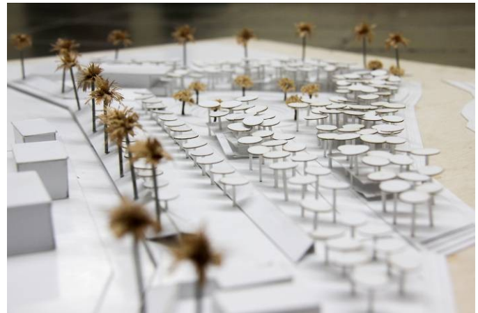
Gambar 11. Foto maket