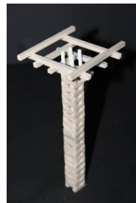
Gambar 9. Bentuk kolom