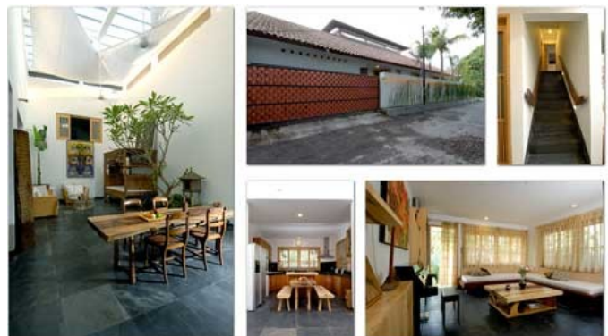
Gambar 2. Arsitektur tradisional dan kontemporer Bali