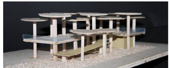
Gambar 7. Contoh bentuk masa bangunan