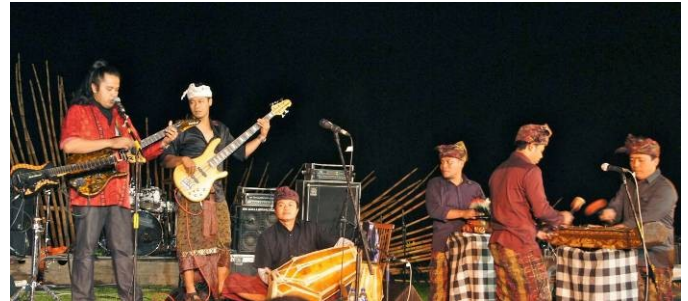
Gambar 1. Akulturasi kebudayaan tradisional dan modern

harus dapat menjadi identitas dari kebudayaan yang diwadahi yaitu kebudayaan masyarakat Bali. Dalam hal ini diperlukan proses merancang yang dapat mewakili kebudayaan masyarakat Bali kini yang kian berkembang tetapi dalam