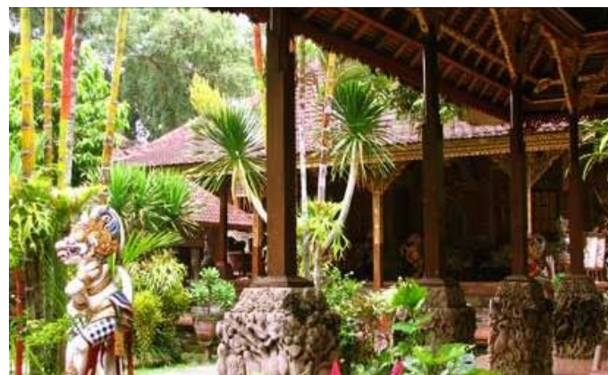
Gambar 5. Pembayangan pada Bale