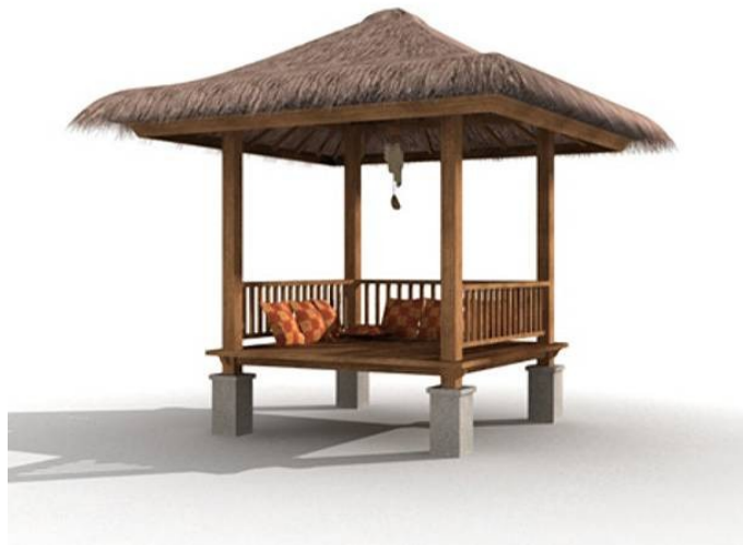
Gambar 4. Contoh Bale