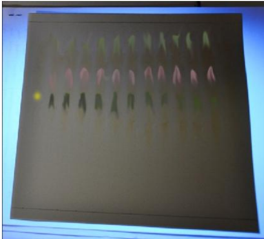
Gambar 1. Foto plat hasil KLT ekstrak daun beluntas dengan eluen BAA (4:1:5) dengan sinar UV 366 nm

Hasil KLT seperti pada gambar 1 kemudian diangin-anginkan dan diperiksa di bawah sinar UV pada panjang gelombang 366 nm. Noda yang terbentuk yaitu sebanyak 3 noda, noda-noda tersebut lalu dilingkari dan dihitung nilai Rfnya. Pemisahan dengan KLT menghasilkan harga Rf dari noda pertama sebesar 0,69. Noda kedua memiliki nilai Rf sebesar 0,78 dan noda ketiga memiliki nilai Rf sebesar 0,89.