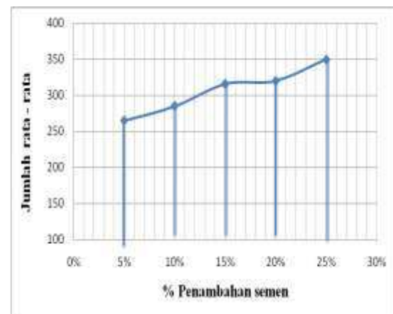
Gambar 2. Hubungan Penambahan Semen Terhadap Jumlah Rata-Rata