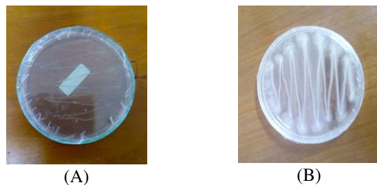
Gambar 1. Hasil pertumbuhan bakteri R. pickettii pada media agar (A) media minimal padat (B) Nutrien Agar

Pada Gambar 1 (A) menunjukkan bahwa bakteri R. pickettii dapat tumbuh dengan baik pada media minimal padat. Hal ini ditunjukkan pada hasil koloni yang berwarna putih pada permukaan agar. Jika dibandingkan dengan Gambar 1 (B), koloni putih dihasilkan lebih tebal pada media Nutrien Agar dibandingkan pada media minimal padat. Ini disebabkan kandungan nutrisi pada Nutrien Agar lebih kompleks dibandingkan pada media minimal padat sehingga sel bakteri yang dihasilkan lebih banyak dibandingkan dengan media minimal padat.