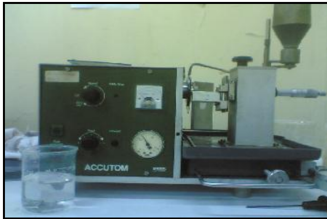
Gambar-1. Alat Potong ACCUTOM Tampak Bagian Depan (Lokasi HR-22)

dimaksudkan agar kegiatan dekontaminasi yang dilakukan tidak menimbulkan kerugian terhadap materi maupun pekerja.