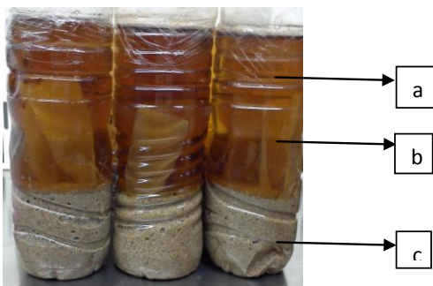
Gambar 1. Kolom Winogradsky Biodegradasi Plastik Putih dengan Inokulum S.

Biodegradasi plastik adalah proses dimana polimer plastik akan dipecah oleh mikroorganisme menjadi oligomer dan monomer penyusunnya dengan mengeluarkan enzim ekstraseluler dan intraseluler pada proses biodegradasi ini [12]. Monomer plastik ditransfer ke dalam sel mikroorganisme melalui membran khusus. Molekul yang diserap oleh mikroorganisme dapat digunakan sebagai sumber karbon dan sumber energi. Produk akhir dari metabolisme mikroorganisme akan menghasilkan biomassa, CO 2 , H 2 O dan CH 4 [2].