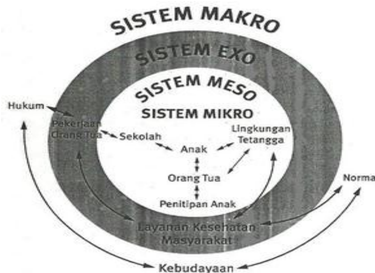
Bagan Model Ekologi Tumbuh Kembang Anak Usia Dini