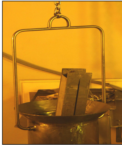
Gambar-3. Penempatan bundel SNF di dalam Basket

Pemindahan bundel RI-EO1 dari hotcell uji no. 02 ke hotcell penerima tidak menggunakan manipulator akan tetapi dengan power manipulator dan alat bantu berupa sebatang baja pejal, \varnothing \pm 1,2 cm dan panjang \pm 40 cm. Tiang statif yang ada di hotcell uji no. 02 dapat digunakan sebagai alat bantu. Pemindahan selanjutnya dari bundel RI-EO1 sama dengan pemindahan bundel RI-SIE2 dan tidak mengalami kendala.