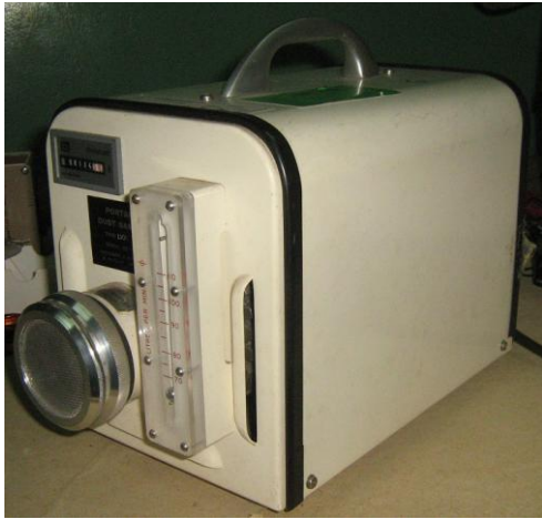
Gambar 1. Alat pencuplik udara