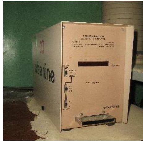
Gambar 2. Alat cacah SAC-4