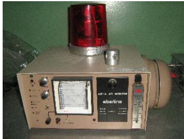
Gambar 3. Alat pantau kontaminasi udara kontinyu

Pilihan untuk pengukuran radioaktivitas di udara dilakukan berdasarkan keperluan hasil data yang akan digunakan atau dianalisis lebih lanjut. Pengukuran secara langsung tanpa penundaan akan menghasilkan hasil ukur radioaktif berumur paro pendek dan yang berumur paro panjang menjadi satu. Pengukuran secara tidak langsung dengan penundaan waktu pencacahan, yang terpantau adalah radioaktif yang berumur paro panjang saja. Mengingat kandungan radioisotop uranium menunjukkan bahwa diperut bumi, mengandung 99,28% U-238, 0,71% U-235 dan 0,0058% U-234 [3] , maka hasil peluruhan radioaktif \alpha yang berada di udara sangat dipengaruhi oleh turunan dari deret uranium-238, yaitu radon-222 yang berbentuk gas.