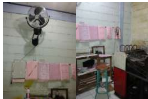
Dokumentasi dibagian Mesin Cetak

Panasnya ruang kerja menyebabkan tidak nyamannya bekerja, pekerja sering melepas baju padahal jarak antar mesin sangat dekat sehingga bisa menyebabkan tergores pada badan. Disamping itu banyak tinta cetak di ruang cetak bila tenaga kerja tidak menggunakan baju tinta dapat kena tubuh secara langsung, hal ini cukup berbahaya karena tinta termasuk bahan kimia.