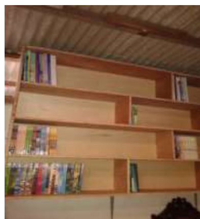
Dokumentasi dibagian finishing (Rak untuk menyimpan/arsip hasil Produksi)

Posisi kerja yang dilantai menyebabkan keluhan nyeri pada punggung dan leher. Ada beberapa pekerja yang memerlukan penekanan dan mengeleman sehingga seringkali tidak menggunakan alas duduk. Pada bagian ini pekerja diberi bantalan duduk supaya cukup nyaman bila duduk dilantai.