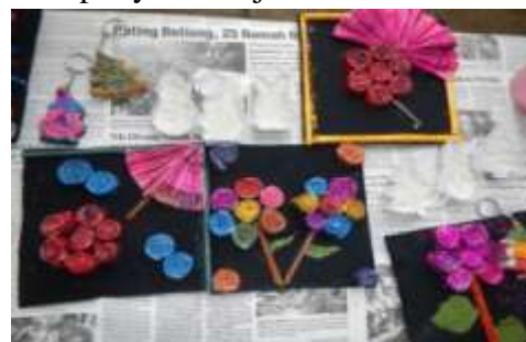
Produk yang dihasilkan dari pengolahan limbah Kertas

hal ini mendapatkan rekomendasi dari Yayasan Setara. SD Servatius menjadi pilihan karena SD tersebut merupakan 90% anaknya adalah pernah turun ke jalanan dan lingkungan keluarganya telah dikenal masyarakat sebagai kampung “Gunung Brintik” yang mengajak anaknya untuk ke jalan. SD Servatius beda dengan sekolah dasar yang lain dan biasanya pulang hingga sore untuk mendapatkan ketrampilan dan mengurangi kesempatan anak dapat turun ke jalan. Anak-anak diajari mengolah limbah kertas milik CV. Majuno serta kertas koran bekas untuk dimanfaatkan menjadi produk yang mempunyai nilai jual.