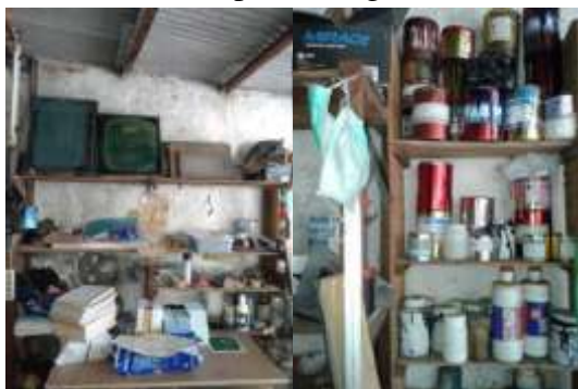
Dokumentasi dibagian Penyablonan

Obat sablon/tinta sablon merupakan bahan kimia yang berbau menyengat. Cukup berbahayanya bahan kimia pada tinta sablon perlu dikurangi dengan mewajibkan para pekerja menggunakan masker selama proses kegiatan.