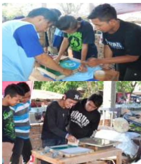
(Pelatihan teknik menyablón pada anak jalanan)

Kegiatan pelatihan penyablonan telah bekerjasama dengan Yayasan Setara dipilihlah anak jalanan di Kelurahan Bugangan, hal ini karena tingginya anak jalanan di Kelurahan Bugangan serta binaan Yayasan Setara. Kegiatan pelatihan telah dilakukan selama 4 hari dari mulai tanggal 19-22 Mei 2015. Sulitnya mendampingi anak jalanan untuk ikut pelatihan telah menjadi kendala tersendiri, hal ini karena sulitnya merubah perilaku turun ke jalan dengan mengikuti pelatihan. Namun permasalahan tersebut diatasi dengan menunjuk koordinator dari anak jalanan untuk mengawasi partisipasi keikutsertaan pelatihan. Disamping anak jalanan yang mengikuti terdapat anak muda yang pengangguran dan ibu-ibu yang berminat untuk mengikuti pelatihan. Kegiatan ini mendapat apresiasi dari Bapak Lurah Bugangan serta Kepala RW dan kader untuk memberikan ketrampilan pada anak jalanan dan pengangguran.