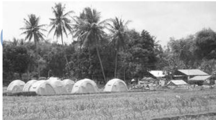
Gambar 5 – Tenda-tenda pengungsi didirikan di sawah, karena kekurangan tanah lapang di Sleman, pada peristiwa gempa tahun 2006.