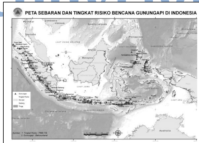
Gambar 2 – Peta Sebaran dan Tingkat Risiko Bencana Gunung Api di Indonesia, menunjukkan bahwa seluruh Sumatera dan Jawa, NTB, NTT, Sulawesi Utara dan Maluku Utara memiliki risiko bencana gunung api.

Potensi bencana di suatu kota dapat dikenali dari pengalaman empirik atau riwayat bencana yang pernah terjadi sebelumnya. Di samping itu juga dapat dipelajari dari peta-peta potensi bencana yang dibuat oleh BMG (Badan Meteorologi dan Geofisika), BNPB, serta Kementerian PU (Pekerjaan Umum).