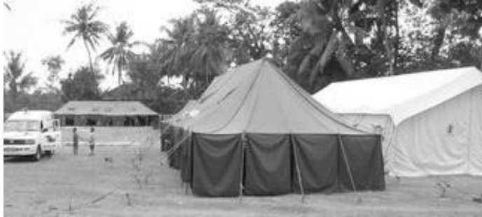
Gambar 4 – Tenda rumah sakit darurat di sebuah lapangan di Sleman, pada peristiwa gempa tahun 2006.