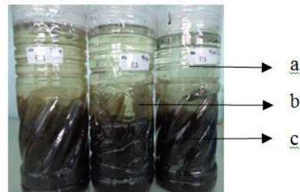
Gambar 1. Uji Biodegradasi dengan Metode Kolom Winogradsky . Keterangan: a. MSM (750 ml). b. Potongan plastik putih bening ukuran 15×4 cm (15 lembar/ botol). c. Tanah sampah sebagai inokulum (750 gr).

Uji biodegradasi plastik yang digunakan dalam penelitian adalah metode Kolom Winogradsky . Kolom ini merupakan miniatur kolom buatan yang berisi tanah atau sedimen [19], yang dapat menjadi salah satu metode pengayaan kultur yang menunjukkan ekologi mikroorganisme pada suatu ekosistem serta stratifikasi donor elektron masing-masing lapisan [17]. Pada kolom tersebut diisi tanah sampah dari Tempat Pembuangan Sampah di Daerah Bulak Banteng Surabaya sebagai inokulum dan Mineral Salt Medium (MSM) dengan rasio 1:1 (Gambar 1). MSM adalah medium mineral minim sumber karbon. Sebagai sumber karbon dalam penelitian ini adalah plastik putih bening yang dibenamkan dalam tanah sampah.