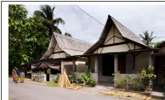
Gambar 2: Bentuk atap Rumah Ngibikan pasca gempa

Seperti yang kita ketahui bahwa ruang bukanlah merupakan sesuatu yang objektif atau nyata namun ruang merupakan sesuatu yang subjektif sebagai hasil pikiran manusia. (Immanuel Kant)