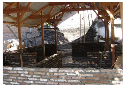
Gambar 3: Bentuk ruang rumah Ngibikan pasca gempa

Menurut dari informasi beberapa warga yang tinggal di sana bahwa bentuk ruang dari rumah di desa Ngibikan pada prinsipnya adalah sama yaitu berbentuk segi empat, segi enam dsb, sedangkan bidang alas atau lantainya ada sebagian yang sudah pakai keramik dan masih ada juga beberapa rumah yang masih berbentuk peluran atau belum dikeramik. Sedangkan untuk dinding atau pembatas ruangnya tetap menggunakan dinding bata tetapi hanya sebagian saja, kurang lebih 1 meter dari tanah menggunakan bata sedangkan keatasnya menggunakan papan, seperti kita lihat gambar dibawah ini: