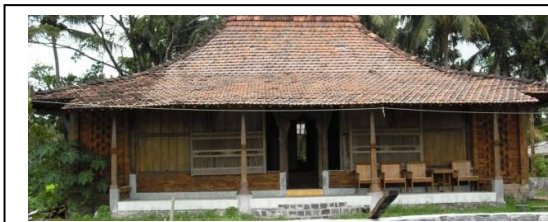
Gambar 1: Bentuk Atap Rumah Ngibikan Pra Gempa

tinggi dari bentuk atap rumah Ngibikan sebelum gempa.