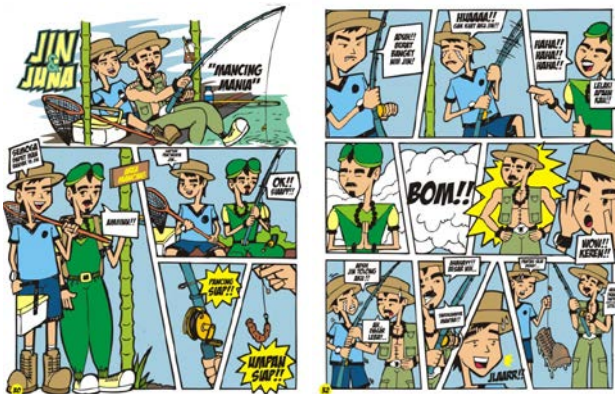
Gambar.3. Tampilan layout paneling komik output desain buku komik matematika.