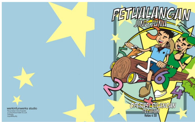
Gambar.2. Tampilan soft cover output desain buku komik matematika.