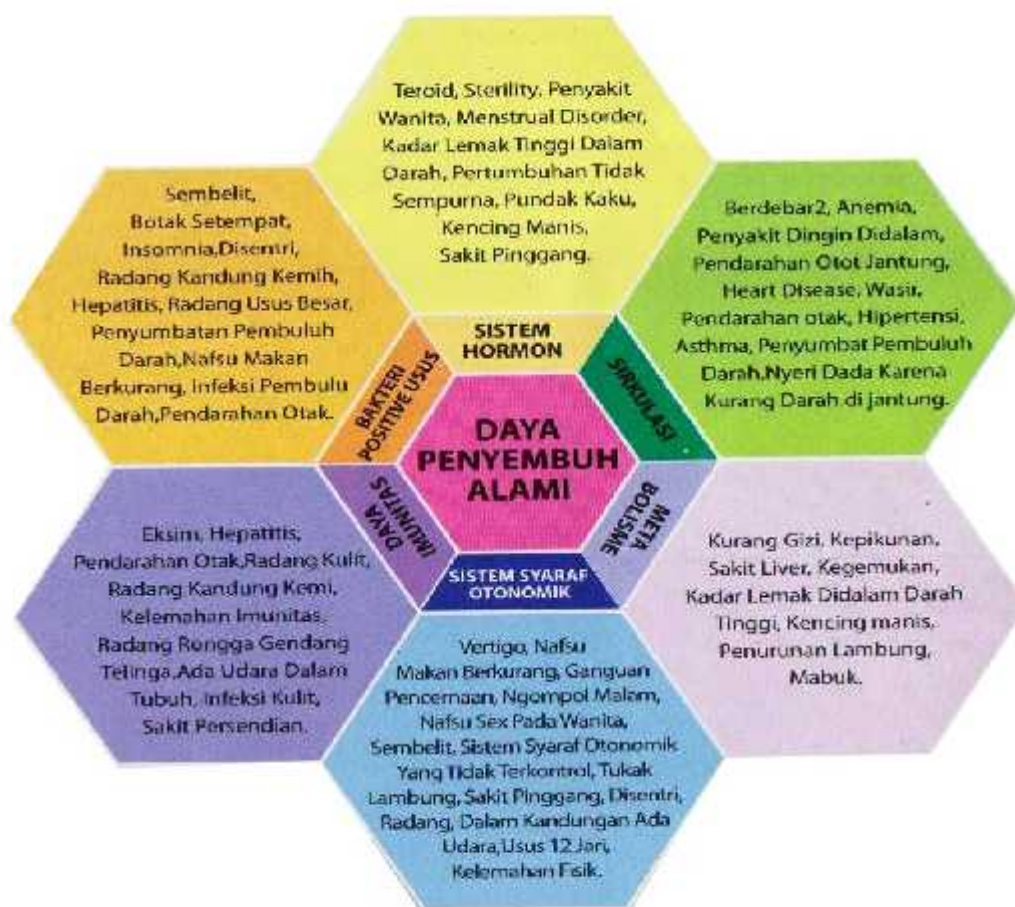
Gambar 2. Enam sistem dalam tubuh

BING HAN Ginseng Powder mempunyai fungsi setingkat lebih tinggi dari makanan kesehatan dan juga memiliki fungsi untuk membenahi dan menormalkan kembali fungsi kelima organ tubuh yang kacau atau rusak, bekerja dengan cara memulihkan daya penyembuh alami tubuh, memberi keseimbangan Ying Yang , memberi nutrisi yang kurang, membuang toksin/racun, membersihkan darah dari asam menjadi basa. Dengan daya penyembuh alami maka keenam sistem dalam tubuh bekerja secara normal dan seimbang seiring dengan ini penyakit mulai disembuhkan secara alami. Keenam sistem dalam tubuh tersebut tercermin dalam gambar 2 berikut :