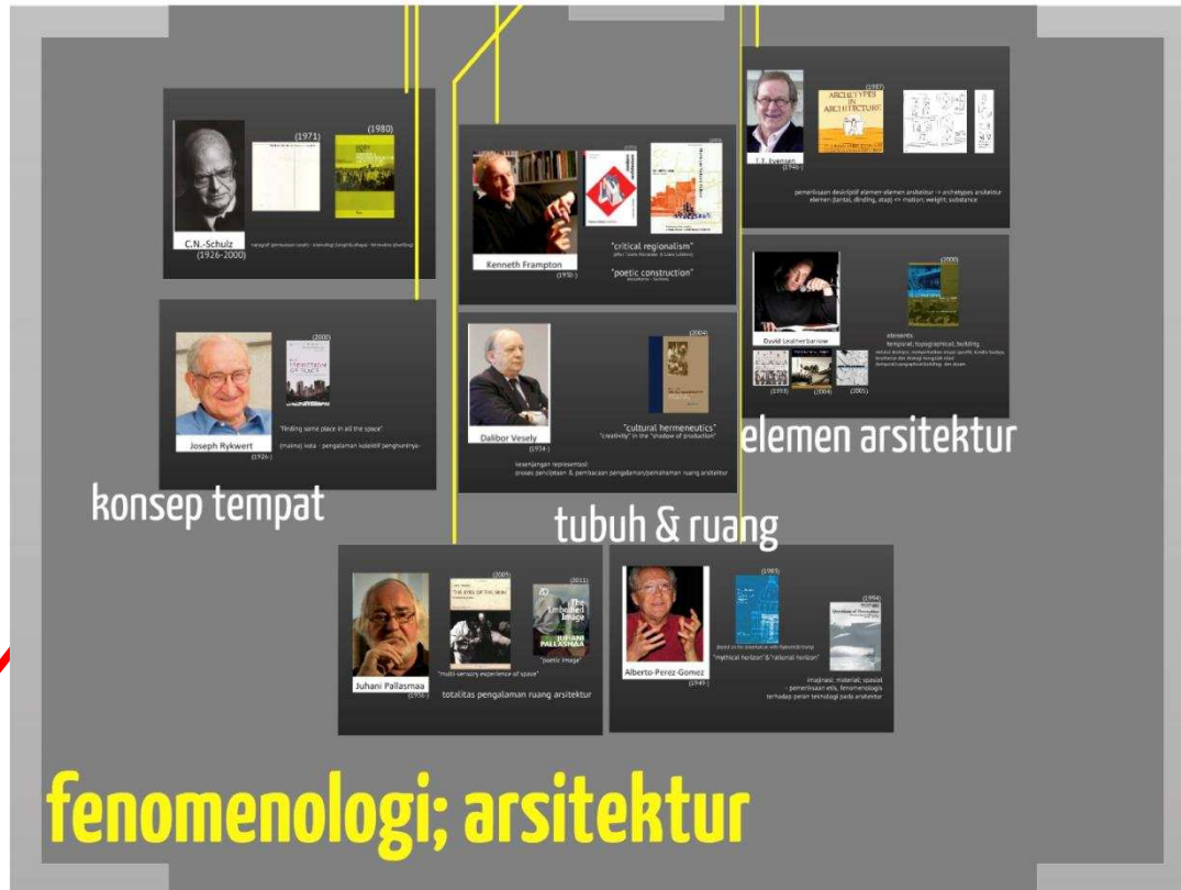
Gambar 2: Pengelompokan para pemikir fenomenologi arsitektur.

Serupa dengan C.N. Schulz, Joseph Rykwert menelusuri gagasan mengenai asal mula arsitektur dan bagaimana modernitas membawa gagasan ruang semakin berjarak dengan gagasan mengenai tempat. Gagasan J.Rykwert mengenai tempat, sebagai bagian dari pandangan fenomenologis dia, tampak jelas pada bukunya The Seduction of Place (2000,