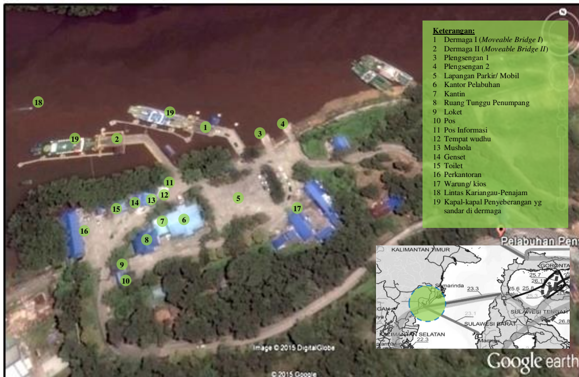
Gambar 1. Lokasi kajian