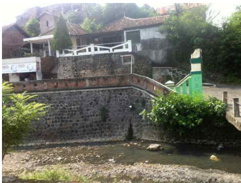
Gambar 3. Stasiun 3 yang berada pada bagian hilir sungai yang alirannya terletak setelah sumber tercemar