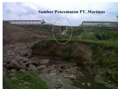
Gambar 2. Stasiun 2 yang berada pada bagian tengah sungai yang alirannya terletak dekat sumber pencemar