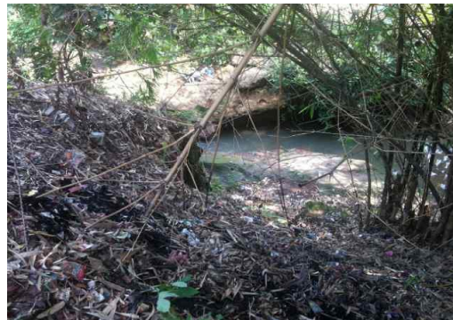
Gambar 1. Stasiun 1 yang alirannya terletak sebelum sumber pencemar

Sungai Klampisan merupakan salah satu sungai yang berada di wilayah Kampung Klampisan, Desa Purwoyoso, Kecamatan Ngaliyan.