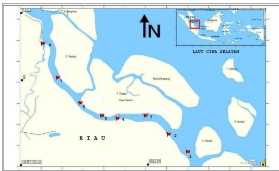
Gambar 1. Sebaran stasiun penelitian (keterangan nama stasiun pengamatan: 1. Pulau Serapung, 2 Pulau Tiga, 3 Pulau Panjang, 4 Tanjung Penakat, 5 Parit Ambai, 6 Tanjung Tanah, 7 Lalan dan 8 muara Sungai Siak)

2013 di perairan estuari Selat Panjang Riau, seperti ditunjukkan pada Gambar 1.