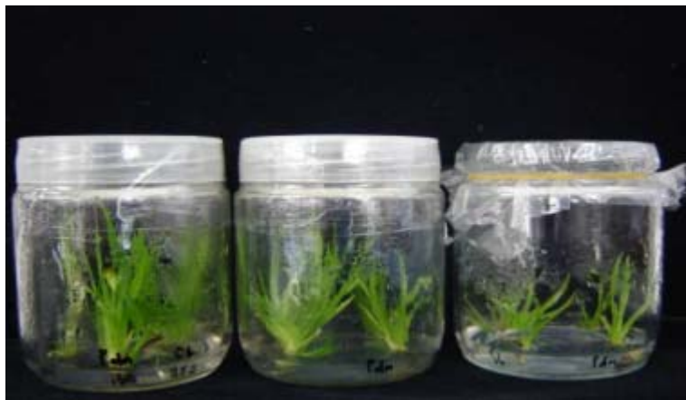
Gambar 1. Kultur mata tunas buah merah pada medium MS perlakuan N0.2, N0.1 dan N0.3 dari kiri ke kanan

Hasil fraksinasi (PE,EA,Et.OH, H 2 O,dan n-Bu OH) kemudian dibuat larutan dengan konsentrasi 10 mg/l dan 5 mg/l untuk diuji pada UV Spectrophotometer dan hasilnya disajikan dalam tabel.2.