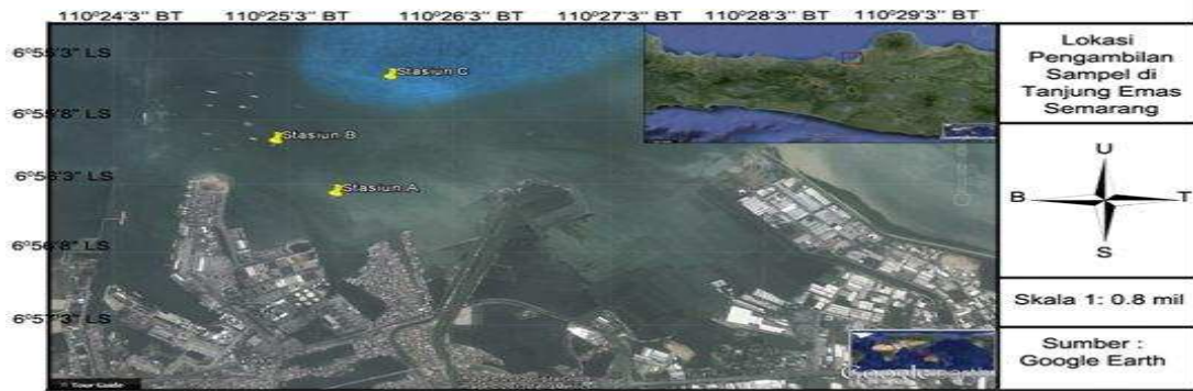
Gambar 2. Lokasi Pengambilan Sampel di Sekitar Tanjung Emas Semarang