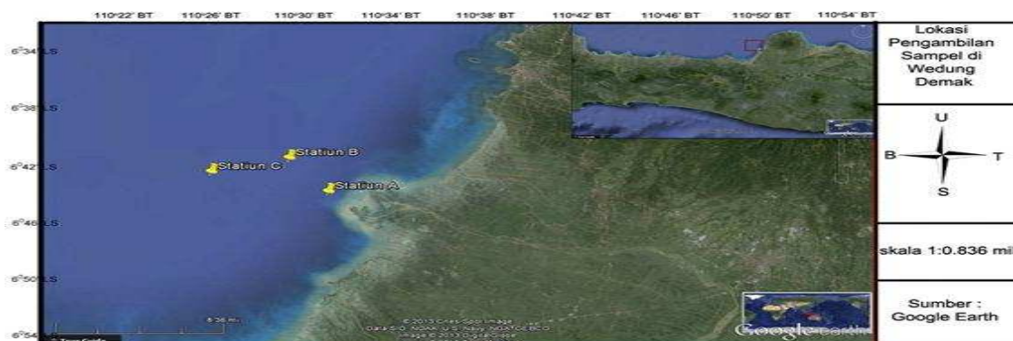
Gambar 3. Lokasi Pengambilan Sampel di Wedung Demak

Menurut hasil wawancara dengan Bapak Hisyam selaku nelayan dari Wedung Demak pada tanggal 15 April 2012, nelayan Wedung biasanya beroperasi setiap hari mulai pukul 06.00 - 13.00 WIB. Jangkauan operasional berada di sekitar perairan Demak sampai ke Kaliwungu. Biasanya nelayan menggunakan alat tangkap garuk gerak, karena alat yang digunakan masih tradisional maka untuk sekali tarik menghasilkan kurang lebih 1 kg kerang dengan lama waktu tergantung dari berat tidaknya garuk tersebut. Jenis kerang yang didaratkan di Wedung cukup variatif dan beberapa diantaranya masih dikenal dengan sebutan lokal antara lain kerang darah (bang/dara), jahe, simping, totok/rambut, jagu, klitik, ceplos.