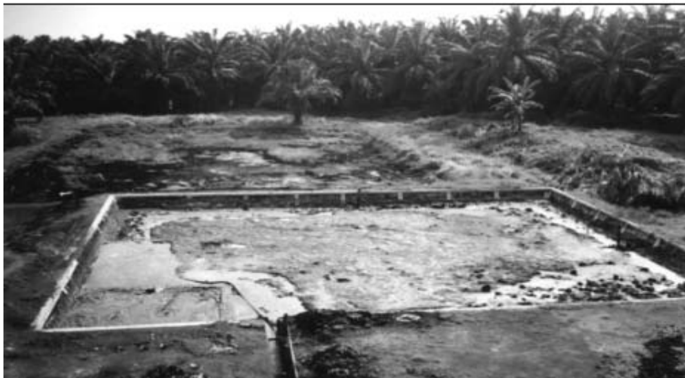
Gambar 4 : Unit kolam aerobik yang sudah penuh dengan lumpur endapa dan mulai terbentuknya channelling.