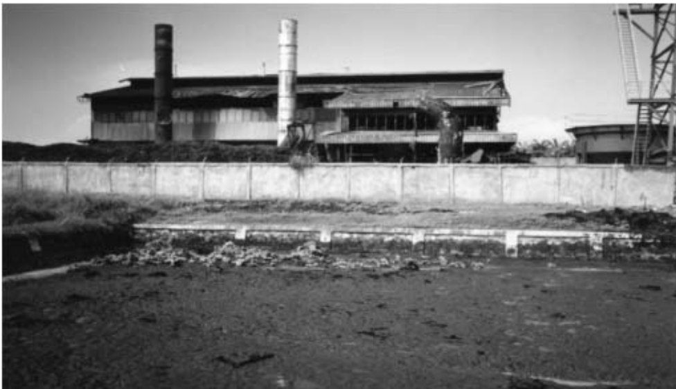
Gambar 3 : Unit kolam anaerobik yang sudah penuh dengan lumpur endapan (gambar latar belakang adalah pabrik kelapa sawit PT. Kertajaya).