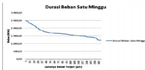
Gambar 3. Grafik Data Beban Harian (kondisi real time ) dan Durasi Bebannya