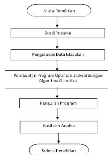
Gambar 2. Alur Penelitian