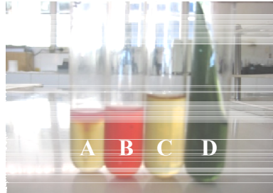
Gambar 3. Foto Hasil Uji Biokimia (IMVIC) bakteri E. coli

Hasil uji Biokimia bakteri E. coli dapat dilihat pada gambar 3 :