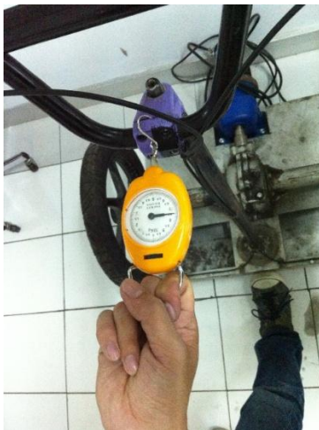
Gambar 9. Menguji kekuatan batang setir

Pengujian setang kemudi segway menggunakan eksperimen dengan menggunakan alat bantu neraca pegas untuk menentukan gaya dorong yang terjadi pada batang setir segway.