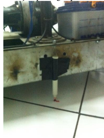
Gambar 11. Menguji belok segway dengan spidol

Pengujian ini ditujukan untuk mengetahui kemampuan rem untuk melakukan manuver belok. Cara melakukan pengujian dengan alat bantu spidol yang dipasang pada body depan segway.