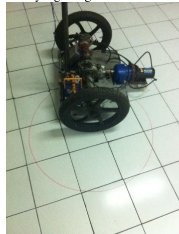
Gambar 12. Pengujian rem pada 1 roda.

Untuk pengujian manuver belok dilakukan dengan cara mengerem salah satu roda dari segway agar berbelok ke arah yang diinginkan.