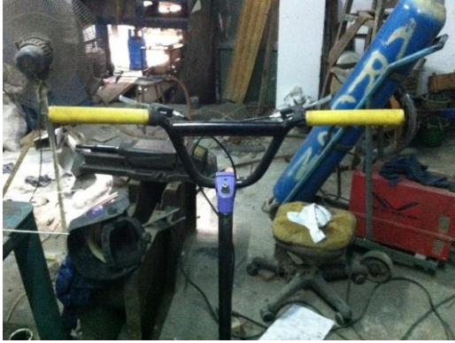
Gambar 6. Stang kemudi segway