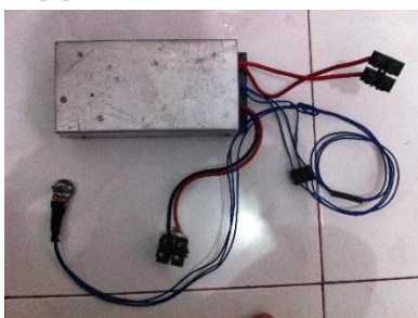
Gambar 6. Driver segway

Potensiometer adalah resistor tiga terminal dengan sambungan geser yang membentuk pembagi tegangan dapat disetel.[3]