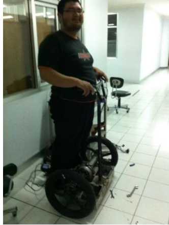
Gambar 8. Pemberian beban

Pengujian body segway ini dengan cara memberi beban kepada body.