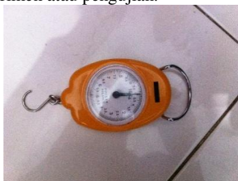
Gambar 3. Neraca Pegas

Untuk menentukan torsi yang dibutuhkan disini tidak menggunakan hitungan tetapi menggunakan alat bantu yaitu neraca pegas / timbangan gantung dikarenakan segway itu sudah jadi sehingga tidak perlu menggunakan perhitungan sistematis dikarenakan bisa ditentukan secara eksperimen atau pengujian.