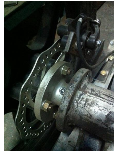
Gambar 5. Sistem rem segway

Stang kemudi disini berfungsi sebagai tempat pegangan tangan dan tempat stang rem diletakan bukan untuk mengemudikan segway karena untuk berbelok segway hanya menggunakan sistem rem yang ada pada segway.