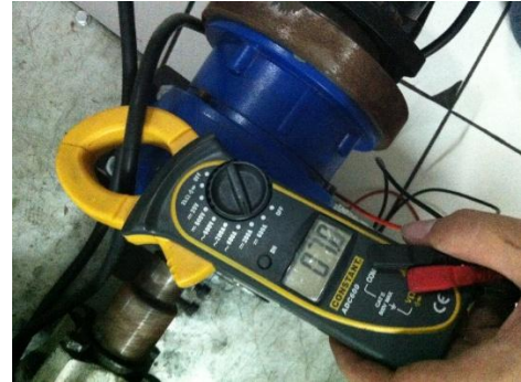
Gambar 10. Pengujian arus pada motor

mampu selama 5 jam, tetapi dikarenakan aki yang kurang prima maka daya tahan aki kuat hanya 57 menit untuk tenaga maximum, dan setelah itu kuat arus dari aki menurun.