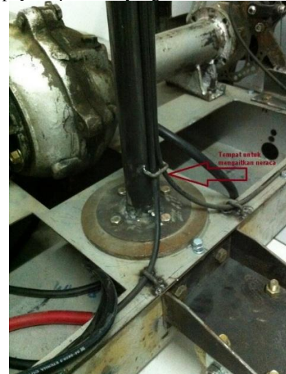
Gambar 4. Tempat untuk mengaitkan neraca pegas

Pertama pastikan ketentuan – ketentuannya di lakukan dengan baik. Untuk melakukan pengujian ini pertama kaitkan neraca pegas pada segway, lalu tarik sehingga segway bergerak dan baca hasil dari neraca pegas tersebut lakukan proses ini minimal 3 kali supaya dapat hasil yang akurat.