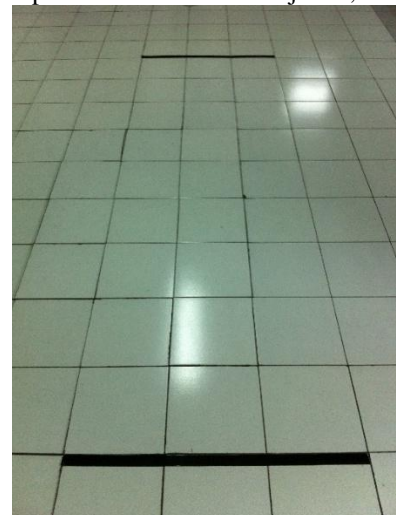
Gambar 7. Contoh lintasan uji segway

Pengujian kecepatan segway dilakukan dengan cara eksperimen jika kecepatan yang diinginkan adalah 10km/h maka dapat disederhanakan menjadi 2,7 m/s.