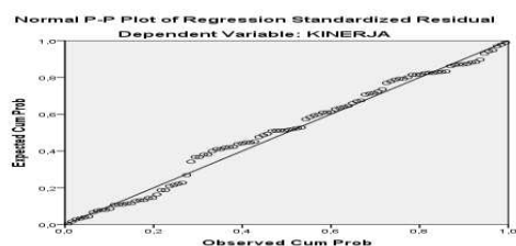
Gambar 1. Regresi Standardized Residual

Dengan bantuan program statistik SPSS for windows versi 21 hasil Uji Normalitas data dapat dilihat pada titik sebaran data yang dihasilkan dalam penelitian ini sehingga dapat disimpulkan bahwa data dalam penelitian ini adalah data normal, seperti diperlihatkan pada gambar berikut ini: