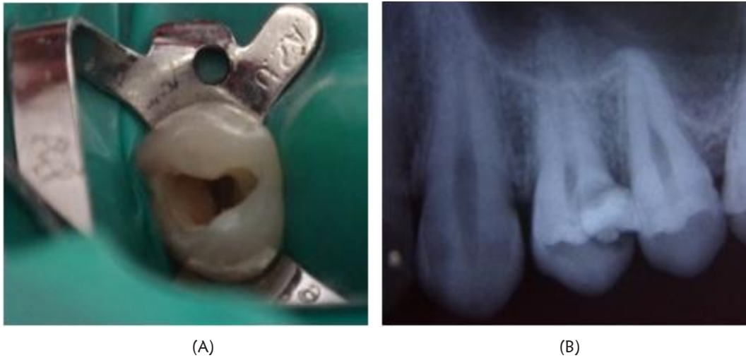
Gambar 1. (A) Gambaran klinis orifice saluran akar terlihat jelas bagian bukal dan palatal dan setelah dibuat artificial wall . (B) Radiografis gigi 24 sebelum perawatan

Berdasarkan hasil pemeriksaan subjektif, objektif maupun radiografis disimpulkan bahwa diagnosis gigi 24 adalah nekrosis pulpa. Perkiraan keberhasilan perawatan atau prognosis baik, karena secara umum pasien kooperatif dan OHI pasien baik, bentuk saluran akar lurus, jelas dan sisa struktur gigi masih banyak dan dapat direstorasi. Rencana perawatan dengan melakukan perawatan saluran akar satu kunjungan dengan menggunakan instrument ProTaper rotary (X-smart, Dentsply) dan restorasi akhir dengan restorasi resin komposit.