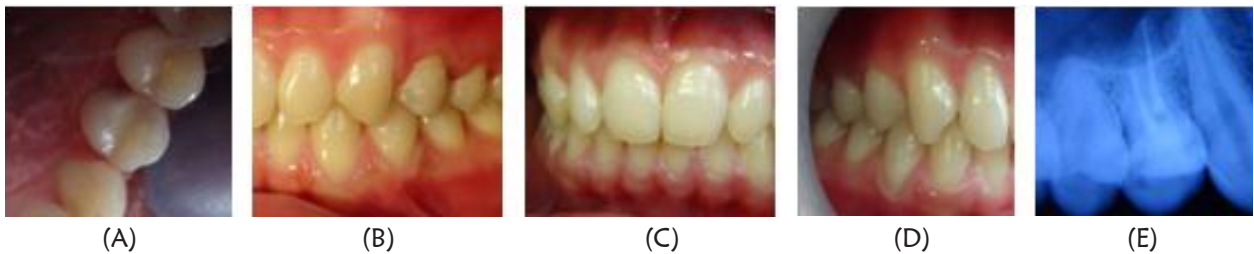
Gambar 3. (A) Gambar klinis setelah ditumpat dengan resin komposit; (B) Tampak saat oklusi gigi 24 tidak ada traumatic oklusi; (C) Relasi oklusi sebelah kanan, tidak ada traumatic oklusi; (D) Relasi oklusi tampak depan, oklusi normal (overjet dan overbite normal); (E) Setelah dilakukan obturasi dan tumpatan resin komposit

komposit pacable (premis A3, Kerr) pada bagian dinding distal, kemudian disinari selama 20 detik. Aplikasi bagian oklusal dan membentuk pit dan fisur menyerupai gigi asli dan di sinar selama 20 detik. Matrik dilepas, oklusi dicek dengan menggunakan articulating paper , bagian yang traumatic oklusi dikurangi dengan bur finishing . Kemudian di polishing dengan brush polishing . Di lakukan rontgen foto, menunjukkan bahwa pengisian baik dan restorasi juga baik (Gambar 3)