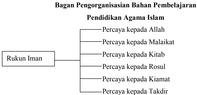
Gambar 2.2 Bagan Pengorganisasian Bahan Pembelajaran PAI