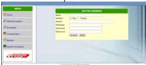
Gambar 4 Tampilan menu konsultasi (daftar) user