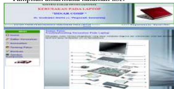
Gambar 1 Tampilan menu utama