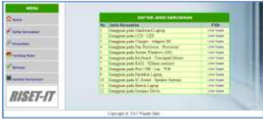
Gambar 2 Tampilan menu daftar kerusakan