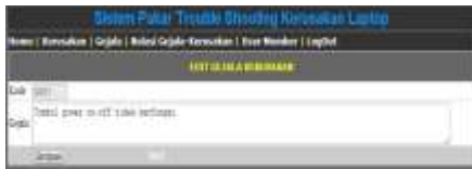
Gambar 14 Tampilan ubah data gejala