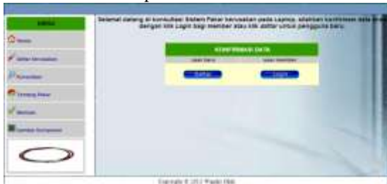
Gambar 3 Tampilan menu konsultasi