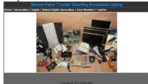
Gambar 10 Tampilan menu home