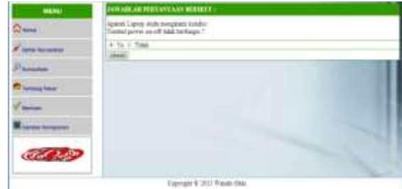
Gambar 8 Tampilan pertanyaan konsultasi