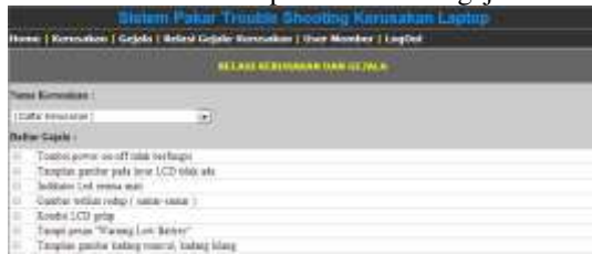
Gambar 15 Tampilan menu data relasi