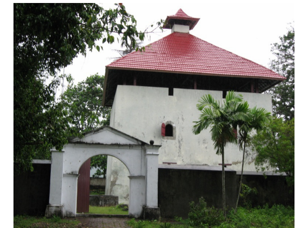
Benteng Amsterdam di Desa Hila, Kecamatan Leihitu (jazirah Leihitu) Kabupaten Maluku Tengah. Secara geografis masih berada di Pulau Ambon.

pola pemanfaatan ruang disebutkan bahwa Kawasan cagar budaya sebagaimana dimaksud pada ayat (1) huruf e tidak terbagi lagi dalam kawasan yang lebih kecil. Berdasarkan Raperpres dan Peraturan pemerintah itu, maka kawasan benteng Kolonial dapat dikategorikan sebagai kawasan Cagar Budaya. Di wilayah Maluku p e n g e m b a n g a n