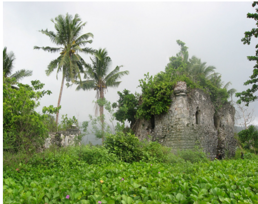
Fort Wantrow, terletak di Pulau Manipa, pulau kecil dan terpencil namun strategis sebagai basis pertahanan kolonial di masa lampau, mengingat lokasi pulau yang terletak ditengah-tengah antara pulau Buru, Pulau

Pada umumnya pola penataan ruang, lebih mengacu pada pola penataan ruang di Eropah, yakni dengan pola pemintakatan atau zoning yang ketat. Dalam pelaksanaannya produk penataan ruang pola zoning tidak efektif, sehingga terbit Instruksi Menteri Dalam Negeri No.: 30 tahun 1985 tentang Penegakan Hukum/ Peraturan Dalam Rangka Pengelolaan