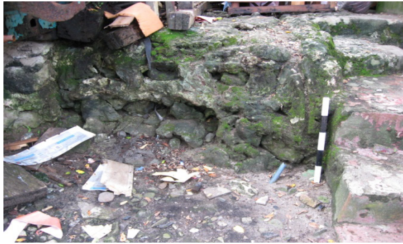
Kondisi kekinian Blokhuys Leiden saat ini, yang tinggal menyisakan puing-puing bekas pondasi benteng. Gambar diambil

Penilaian terhadap kawasan benteng-benteng kolonial, mengingat kondisi perkembangan kawasan yang diakibatkan oleh gejala penurunan kualitas lingkungan maupun dinamika perkembangan sosial budaya di kawasan tersebut. Serageldin (2000) menjelaskan, gejala penurunan kualitas fisik dapat