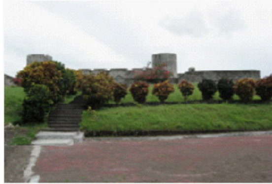
Benteng Belgica, Ikon utama Kota Kolonial Banda Neira yang tampak masih utuh dan menjadi obyek wisata budaya di Banda Neira.