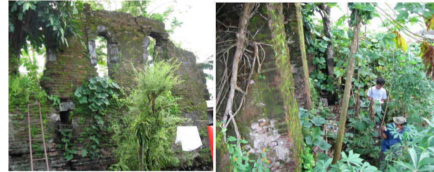
Benteng Midlesborgh (Benteng Passo), terletak di Kota Ambon, saat ini berada diantara kepungan permukiman penduduk kota Ambon. Tampak penulis dan Surveyor PDA,

Dalam Rancangan Peraturan Presiden Tentang Rencana Tata Ruang (RTR) Kepulauan Maluku Bab I bagian I poin 12 menyangkut pengertian tentang Kawasan Cagar Budaya adalah tempat serta ruang di sekitar bangunan bernilai budaya tinggi, situs purbakala dan kawasan dengan bentukan geologi tertentu yang mempunyai manfaat tinggi untuk pengembangan ilmu pengetahuan. Selanjutnya pada Bagian Ketiga menyangkut Strategi Perwujudan Pola Pemanfaatan Ruang, Paragraf