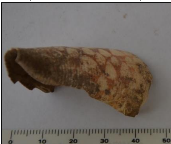
Gambar 5. Conus bandanus