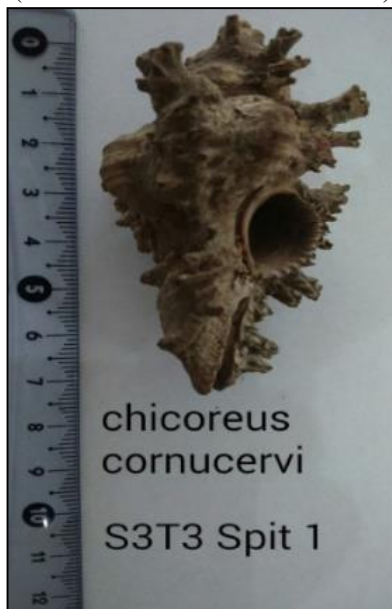
Gambar 6. Profil Moluska Chicoreus cornucervi sisi bawah