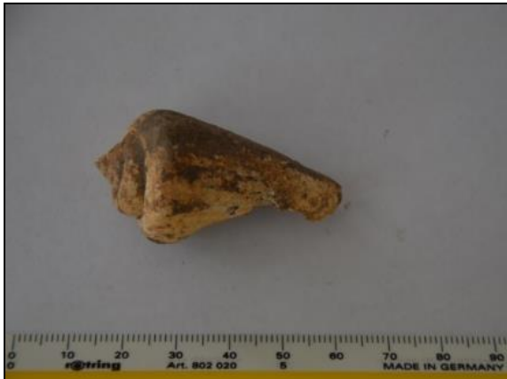
Gambar 4. Conus nocturnus dan Conus bandanus