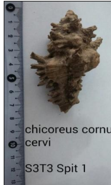
Gambar 7. Profil Moluska Chicoreus cornucervi sisi punggung (Sumber: Dok. Balar Ambon 2014)

Informasi yang dapat kita peroleh dari tabel kategorisasi zona terestrial diatas adalah bahwa lebih banyak himpunan kerang/moluska yang memiliki kecenderungan sebagai biota/fauna dari Zona Kawanan Sahul. Hal ini dapat terlihat dari temuan kerang/moluska Chicoreus cornucervi dan Conus bandanus , dan bahkan untuk moluska Conus bandanus sendiri, memiliki nama lokalitas khusus ditilik dari Pulau Banda yang memang letaknya persis di bawah Pulau Seram.