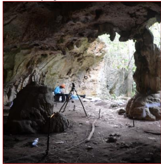
Gambar 1. Perekaman data di Gua HTS-18

berkembang dengan cepat. Hal tersebut turut mempengaruhi jaringan sungai ke laut sehingga menyebabkan pemisahan flora dan fauna baik diatas daratan maupun di bawah lautan. Kondisi ini pula yang memiliki andil sehingga menyebabkan tahap-tahap kontinental (glasial) dan pulau (interglasial) berbanding lurus dengan habitat biotik yang terkandung di dalamnya termasuk kuantitas air tawar dari sungai-sungai yang memasuki lautan. Pada kala Pleistosen, baik Daratan Sunda maupun Daratan Sahul berada di atas permukaan laut sebagai kawasan kontinental yang luas (Bellwood, 1997: 47).