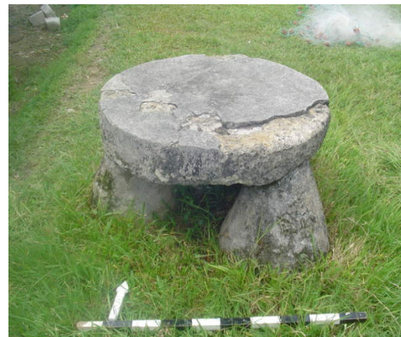
Gambar 3. Dolmen Batu Meja, Desa Nolloth, Kec. Pulau Saparua, Kab. Maluku Tengah, Propinsi Maluku

Pemukiman lama/negeri lama dan dolmen (batu meja) , bagi masyarakat Maluku, khususnya Maluku Tengah sangat erat kaitannya. Setiap akan melakukan acara pelantikan Raja, calon Raja harus mengunjungi negeri lama untuk bermalam disana batawana dan melakukan tarian maku-maku . Tujuan daripada hal tersebut adalah tidak lain untuk memperkenalkan calon raja kepada para leluhur, dengan maksud agar calon raja dapat memimpin negeri/desa dengan baik, jujur dan tidak sembarangan. Oleh Sunarningsih disebutkan bahwa manusia adalah makhluk individu bergantung pada alam sekitar atau lingkungan. Sebagai makhluk manusia bergantung pada manusia lainnya untuk memenuhi kebutuhan hidupnya. Kedua sifat manusia tersebut menyebabkan dalam kehidupan lebih memilih untuk hidup berkelompok, pada akhirnya manusia dapat menguasai teknologi pembuatan tempat tinggal dan dimulainya kehidupan menetap. Oleh sebab itu hubungan manusia dengan alam direpresentasikan lewat tradisi-tradisi berlanjut, dimana batu meja dolmen dijadikan sebagai benda bendawi dipergunakan dari masa ke masa (Latifundia, 2007 : 25).