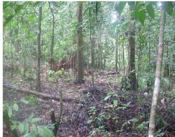
Gambar 2. Kampung Lama Situs Huhule, Desa Tuhaha, Kec. Pulau Saparua, Kab. Maluku Tengah, Propinsi Maluku

satu kesatuan yang utuh. Sebab hubungan keduanya bersifat temporal parsial (Koentjaraningrat, 1987 : 172-184).