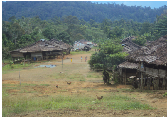
Gambar 5. Permukiman Tradisional Orang Huaulu di Seram Utara, Kabupaten Maluku Tengah Propinsi Maluku

tradisional orang Huaulu dan Nuaulu di Pulau Seram. Sistem nilai budaya mereka sangat terjaga dengan baik, sehingga nilai sosial budaya masih terpelihara sekalipun dinamika perkembangan dunia tetap jalan seiring waktu. Untuk konteks kedua, tinggalan arkeologi memang dipandang sebagai sesuatu benda mati, tetapi nilai dibalik benda mati itu sendiri sangat besar bagi kepentingan makhluk hidup Maluku ke masa-masa mendatang dan Indonesia umumnya.