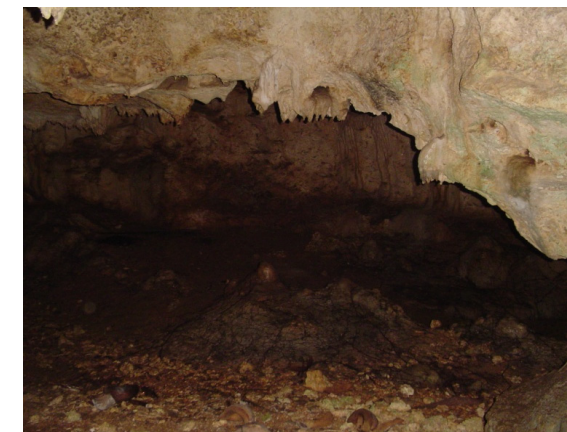
Gambar 6. Gua prasejarah Hatuurang Negeri Hatusua, Kab. Seram Bagian Barat, Propinsi Maluku (Sumber : Dokumen Balai Arkeologi Ambon, 2009)

Contoh lain, situs Gua Hatuurang yang berada di daerah Pulau Seram Bagian Barat, tepatnya di Desa Hatusua. Menurut budaya tutur masyarakat setempat bahwa dulu Hatuurang adalah lokasi kompleks manusia Seram Barat bermukim. Dari sisi arkeologi situs Hatuurang memang sangat komperhensif untuk menetap. Karena dekat dengan sumber bahan makanan, dan dekat juga laut. Oleh Soejono mengatakan bahwa manusia prasejarah, khususnya Plestosen akhir sampai awal Holosen, dalam mempertahankan hidupnya masih bergantung pada ketersediaan lingkungan alam sekitarnya. Di Asia Tenggara, kehidupan gua ( cave ) atau ceruk ( Rock shelter ) mencapai puncaknya pada kala Holosen. Dikatakan lanjut oleh Heekeren dalam memanfaatkan gua/ceruk sebagai tempat tinggal, manusia saat itu telah mempertimbangkan masak-masak. Tidak semua gua atau ceruk dimanfaatkan sebagai tempat tinggal (tempat bermukim). Dari aspek keletakan, manusia saat itu cenderung memilih lokasi gua atau ceruk pada daerah-daerah yang menyediakan kebutuhan pokok, seperti sumber bahan makanan aquatic atau non aquatic yang dianggap menguntungkan dari segi subsistensinya (Asikin, 2012: 1).