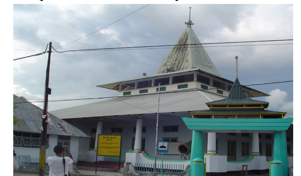
Gambar 7. Mesjid di Pulau Bacan, Propinsi Maluku Utara

Dolmen, menhir, negeri lama/ permukiman lama bagian integral dari sebuah sistem sosial budaya. Ketiga tinggalan arkeologis ini sangat erat kaitannya dengan masyarakat adat di Kepulauan Maluku. Seperti yang telah dijelaskan sebelumnya sifat ketiga tinggalan arkeologi ini temporal parsial (saling keterkaitan antara satu dengan yang lain). Mesjid dan gereja tua , secara eksplisit melambangkan kekuasaan pada waktu itu serta perkembangan masyarakat dari fase ke fase. Masjid identik dengan Islam , seperti yang kita ketahui bahwa perkembangan Islam di Indonesia umumnya dan Kepulauan Maluku khususnya telah berlangsung abad-abad lamanya sebelum masuknya bangsa penjajah (gereja). Pada dasarnya Islam di Maluku, dapat ditelusuri dengan tinggalan-tinggalan arkeologis, diantaranya arsitektur, pola sebaran, ajarannya dan budaya tutur atau etnografi (Handoko, 2011 : 27- 40). Interpretasi makna dari tinggalan arkeologi telah memaknai substansi nilai, norma, falsafah dan bahkan seluruh aspek sosial budaya didalamnya. Implikasi pemaknaan tinggalan arkeologi adalah tidak lain memberikan gambaran perspektif terhadap umat manusia (masyarakat) bahwa konstruksi awal peradaban manusia memang seperti ini, dan untuk itu diperlukan pemahaman dan penelusuran lebih atas gagasan-gagasan, dan ide kebudayaan. Budaya benda bendawi tinggalan arkeologi Islam sebagai representasi pemaknaan simbol daripada nilai sosial budaya manusia.