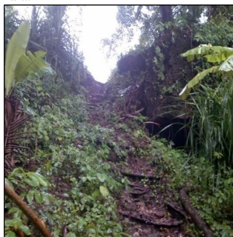
Gambar 1. Jalan Masuk menuju Negeri Lama Tohia, di Desa Haya

Masuknya Islam di Negeri Tamilow dan Negeri Haya, tampaknya sama halnya dengan informasi di wilayah lain di Maluku, pada umumnya mengungkapkan bahwa Islam pertama kali diperkenalkan di suatu negeri, awalnya ketika masyarakat masih menghuni kawasan perbukitan yang disebut negeri lama. Di Negeri Haya, awalnya Islam diperkenalkan di Negeri Lama Haya yang disebut dengan Leisilala.