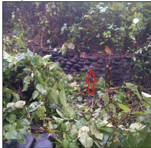
Gambar 2. Bekas Pondasi Masjid Kuno di Desa Haya

Dari survei arkeologi di Negeri Haya, ditemukan data lapangan, berupa tumpukan batu pipih berwarna hitam yang disusun rapi membentuk persegi. Sebagian struktur batu tersebut dalam kondisi yang sudah runtuh. Melihat bentuk strukturnya, susunan batu itu dibentuk secara sengaja dan dikerjakan oleh masyarakat dengan teliti. Kemungkinan tumpukan batu pipih itu adalah struktur pondasi masjid. Tinggi susunan batu dari permukaan tanah mencapai 60 cm, mungkin lebih rendah dari ukuran yang sebenarnya, karena dari yang ada sekarang, kemungkinan tidak lagi menampakkan susunan batu itu secara utuh.