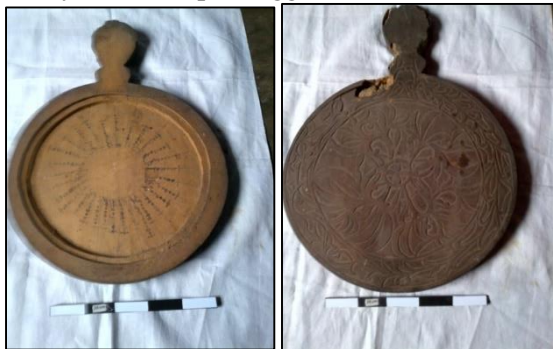
Gambar 6. Lempeng I Naskah Peratanggalan Kuno ditulis diatas lempengan terbuat dari kayu

semacam ramalan-ramalan dan di lempeng yang lainnya memuat pertanggalan.