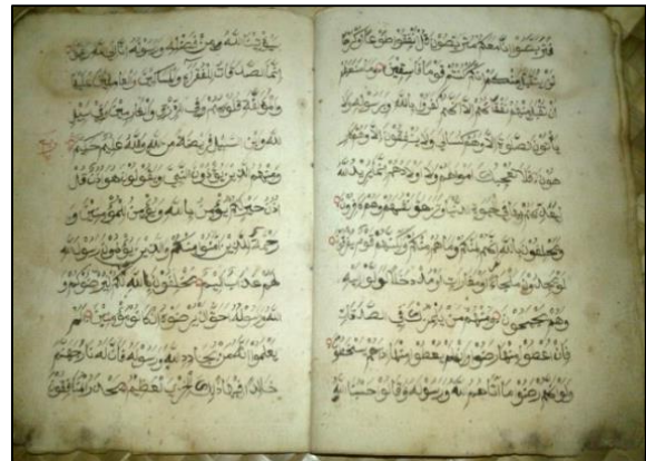
Gambar 5. Naskah Al Qur’an Kuno Koleksi Ahmad Tamagola, Desa Tamilouw

Meskipun masjid kuno sudah hancur, namun alat-alat kelengkapan masjid, beberapa diantaranya masih tersimpan, yakni naskah-naskah kuno berupa Al Qur’an kuno dan Lempengan Kayu berupa naskah primbon. Kedua naskah milik koleksi Ahmad Tamagola. Al Qur’an kuno terbuat dari kertas Eropa, terdiri dari 30 juz. Berbeda dengan jenis Al Qur’an kuno lainnya yang pernah ditemukan di Maluku, Al Qur’an ini setiap juz terpisah satu sama lain tidak dalam satu jilid penuh. Jadi setiap juz dijilid terpisah-pisah. Dalam lembaran naskah tidak ditemukan gambar ilustrasi dan iluminasi naskah. Ukuran naskah, panjang 21 cm dan lebar 16 cm, sedangkan pada halaman kertas, ukuran naskah panjang 16, dan lebar 11 cm. Kondisi naskah sudah lapuk dan tampak kurang terawat, beberapa bagian lembaran naskah banyak yang rusak dan tak terbaca.