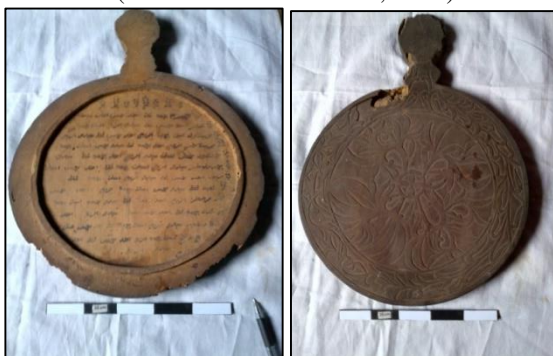
Gambar 7. Lempeng II Naskah Peratanggalan Kuno ditulis diatas lempengan terbuat dari kayu

Dari dua sisi lempeng, masing-masing lempeng bagian dalamnya berisi catatan yang berbeda. Lempeng I , berupa lingkaran konsentris yang dibagi rata menjadi 30 bagian yang sama besar, setiap bagian itu ditandai oleh tulisan yang berisi nama-nama binatang mungkin simbol ramalan tertentu dan simbol-simbol angka yang tidak dipahami. Nama nama binatang yang tertera diantaranya yang dapat baca adalah kambing, jaran (bahasa Indonesia: kuda), ikan, kujang (kijang?), sapi, kerbau, gajah dan lain lain. Di bawah yang tertera nama-nama binatang terdapat lingkaran-lingkaran kecil berjumlah 5-6 yang disusun ke bawah, mungkin menyimbolkan jumlah hari tertentu. Catatan ini sulit dipahami maksudnya, tetapi mungki berhubungan dengan ramalan-ramalan atau primbon yang berasal dari Jawa. Pada Lempeng II , catatan yang tertera berupa nama-nama hari, yang disusun tidak berurut.