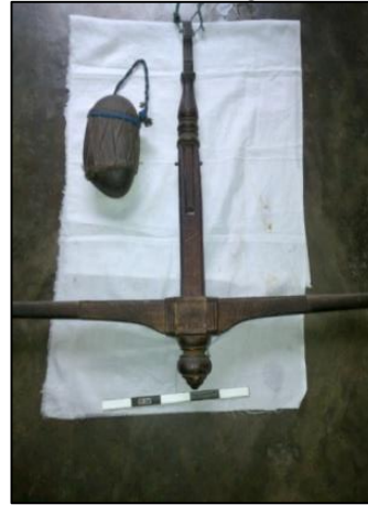
Gambar 8. Timbangan zakat fitrah dan batu timbangannya di Negeri Tamilouw

perlengkapan masjid kuno di Maluku. Ukuran timbangan terdiri dari panjang tangkai 67 cm dan panjang timbangan 71 cm. Sebagi pemberat terbuat dari batu andesit, menjadi pemberat timbangan zakat fitrah 2,5 kg.