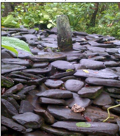
Gambar 3. Makam Kuno di Negeri Lama Tohia, Desa Haya

banyak menampung jumlah penduduk yang melakukan shalat. Meski demikian, temuan bekas struktur pondasi masjid, membuktikan bahwa Islam awal di Negeri Haya, menjadi bukti paling valid, perkembangan Islam. Hal ini karena, masjid dapat dianggap sebagai ikon utama, atau penanda paling spesifik dan paling jelas, bagaimana Islam tumbuh dan berkembang di wilayah Maluku (Handoko, 2012: 39). Masjid dapat dianggap sebagai ikon atau ciri utama sebuah situs Kerajaan Islam, hal ini karena dalam tradisi Islam sejak Nabi Muhammad SAW pendirian kerajaan Islam senantiasa didahului dengan pembangunan masjid serta dianggap sebagai pusat kegiatan dalam segala aspek kehidupan umat (Salam, 1960: 19; Gazalba, 1966; Mahmud, 2003: 40).