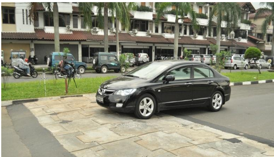
Gambar 3 Bentuk Portable Speed Humps

Perlengkapan utama yang digunakan adalah speed hump dan sound level meter . Speed hump yang digunakan mempunyai tinggi 10 cm dan panjang 400 cm. Lebar speed hump ini disesuaikan dengan lebar jalan tersebut, yaitu 7 m. Speed hump tersebut menggunakan bahan dasar beton aspal dan bersifat portable yang dirancang khusus sehingga dapat dilakukan bongkar pasang, seperti terlihat pada Gambar 3.