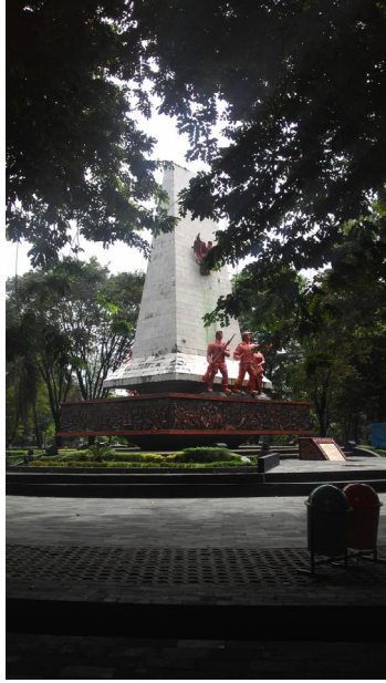
Foto 1.2. Kondisi Monumen 45 Taman Banjarsari setelah direnovasi