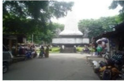
Foto 1.1 Kondisi perubahan fungsi taman Banjarsari sebagai tempat berkumpulnya pedagang kaki lima, sebelum direnovasi pada tahun 2007

Jumlah pedagang kaki lima di taman Banjarsari mengalami peningkatan, menurut pendataan yang dilakukan Tim City Development Strategy (CDS) Kota pada waktu itu.