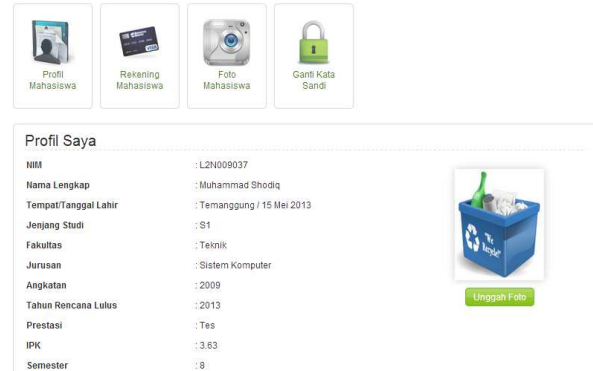
Gambar 3.2 halaman profil mahasiswa

Berikut ini, pada gambar 3.3 adalah salah satu contoh rancangan antarmuka yang ada pada Aplikasi Sistem Informasi Beasiswa :