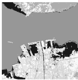
Hasil Metode 2