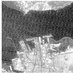
Gambar 2. Contoh Citra Input

Contoh Citra input dapat dilihat pada Gambar 1 dan Gambar 2, yakni citra dari daerah Surabaya dari Band ke-5.