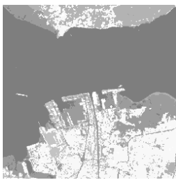
Hasil Metode 1

Sedangkan citra output dari gambar di atas terdapat pada Gambar 3. Output yang dihasilkan oleh Metode 1 dan Metode 2 tersebut berdasarkan data input yang sama. Memang secara sepintas dengan kasat mata, tidak nampak perbedaan yang signifikan, namun bila digunakan analisa kuantitatif sebagaimana tersebut di atas, akan nampaklah perbedaan diantara keduanya.