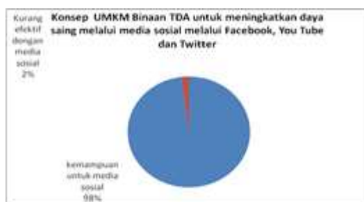
Gambar 3. Konsep UMKM Binaan TDA untuk meningkatkan daya saing melalui media sosial melalui Facebook, You Tube dan Twitter

pengembangan kewirausahaan di Kota Medan untuk meningkatkan daya saing dalam konsep pemasaran global dan mayoritas semuanya responden memberikan rekomendasi dalam mempromosikan produk diperlukan media sosial sebagai tempat promosi yang efektif, murah dan dapat terjangkau diseluruh dunia. Namun untuk member TDA yang masih baru bergabung menyatakan, kurang efektif untuk melakukan promosi penjualan melalui media sosial dikarenakan masih menggunakan metode konvensional dan masih baru berkiprah di komunitas TDA, namun melalui kegiatan mentoring bisnis, maka akan diwujudkan suatu pemikiran dari mindset yang lebih berkembang.