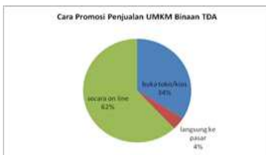
Gambar 4. Cara Promosi Penjualan UMKM Binaan TDA

Konsep promosi penjualan UMKM binaan TDA dalam meningkatkan daya saing sangat diperlukan untuk menggunakan metode yang efektif. Untuk UMKM binaan TDA selalu melakukan penjualan secara on line secara mayoritas dan menjadi dasar peningkatan produk yang dimiliki oleh para mereka. Jika ingin menguatkan basis dari promosi diperlukan secara legitimasi dengan membuka toko/kios dan diakhiri langsung terjun ke pasar sebagai brand image produk. Terjun ke pasar merupakan prinsip dasar dalam melakukan penetrasi pasar.