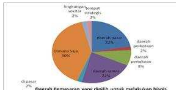
Gambar 7. Daerah pemasaran yang dipilih untuk melakukan bisnis

Dari Kota medan, UMKM Binaan TDA dalam menjawab pertanyaan daerah pemasaran yang dipilih untuk melakukan bisnis adalah Dimana saja yang terpenting dan dapat aspek strategis yang utama agar bisa menjadi lebih mudah dijangkau oleh pembeli serta dikuti oleh daerah pasar dan daerah ramai yang dapat dijangkau dan dengan dengan akses publik yang menjadi tonggak perkembangan bisnis di Kota Medan.