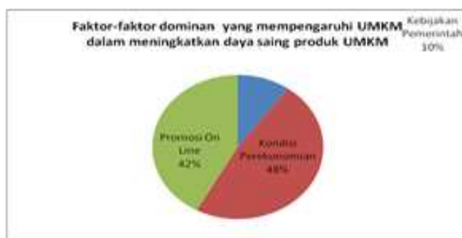
Gambar 2. Faktor-faktor dominan yang mempengaruhi UMKM dalam meningkatkan daya saing produk UMKM

Untuk meningkatkan usaha, dari 50 responden TDA, memberikan beberapa pendapat mengenai faktor-faktor dominan UMKM dalam meningkatkan daya saing UMKM. Hasil yang diperoleh ada 3 hal utama yang bisa yaitu 1. Kondisi perekonomian yaitu keadaan yang mempengaruhi nilai tukar rupiah, kenaikan Bahan Bakar Minyak (BBM), hingga keadaan inflasi dan deflasi, lalu diikuti dengan yang 2. Yaitu Promosi on line yang tersebar melalui media sosial dan yang berikutnya yang menjadi faktor ketiga adalah diperlukannya kebijakan pemerintah untuk memberikan situasi kondisi yang bisa memberikan pengucuran Program Kemitraan Bina Lingkungan (PKBL) ataupun Corporate Social Responsibility (CSR) dari perusahaan BUMN maupun program dana bergulir dengan kemitraan dari perbankan agar bisa menjaga hubungan baik dalam sistem pengembalian dan disinergikan dengan pelatihan bisnis dan pameran bisnis UMKM di dalam maupun luar negeri.