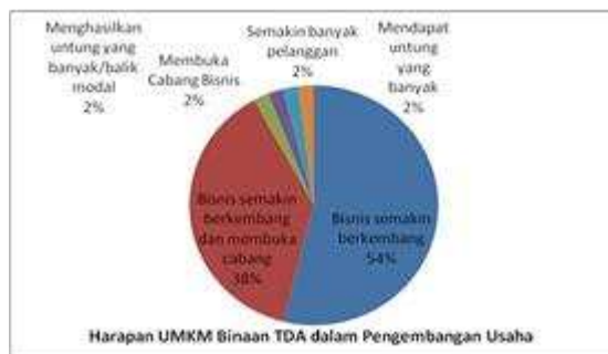
Gambar 10. Harapan UMKM Binaan TDA dalam pengembangan usaha

UMKM Kota Medan mampu menjaga stabilitas pembangunan ekonomi Kota Medan dan meningkatkan inovasi bisnis agar bisa berkembang di persaingan global .