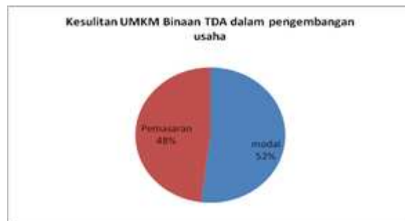
Gambar 6. Kesulitan UMKM Binaan TDA dalam pengembangan usaha

Setiap UMKM tentunya mengalami kesulitan dalam menjalani usaha. Yang terpenting bukan kesulitan yang menjadi kendala dalam pengembangan usaha. Kebanyakan dari UMKM binaan TDA mengalami kesulitan yang utama adalah Modal, namun dapat diselesaikan dengan banyaknya mitra kerja dari TDA yang bisa dikoneksikan dan dilanjutkan dengan program pemerintah dan BUMN yang sebelumnya dilakukan kelengkapan dari kelayakan usaha, agar didapat pengucuran dana PKBL dan CSR yang menjadi bantuan modal bagi UMKM. Selanjutnya jaringan pemasaran yang dibutuhkan untuk menjadi tolak ukur pengembangan usaha dan cara meningkatkan kualitas produk.