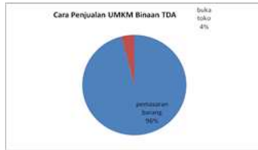
Gambar 5. Cara Penjualan UMKM Binaan TDA