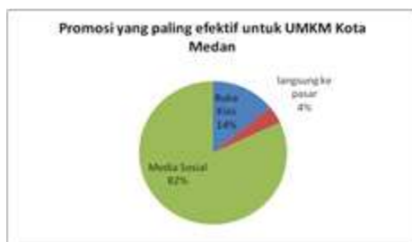
Gambar 1. Promosi yang paling efektif untuk UMKM Kota Medan

Dari hasil responden terdapat 3 cara yang paling efektif untuk melakukan promosi sebagai strategi peningkatan UMKM Kota Medan yaitu: 1. Menggunakan media sosial seperti facebook, twitter, path, website , dll diikuti dengan yang 2. Membuka Kios yang bisa dilakukan untuk meningkatkan image produk dan diakhiri oleh 3. Terjun ke pasar yaitu metode yang dilakukan dengan menjemput bola untuk mengambil konsumen hingga membentuk link bisnis agar bisa menjadi suatu komoditas yang paling utama dalam meningkatkan hasil usaha.