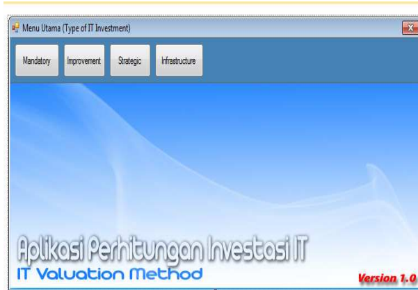
Gambar 4. Antarmuka Tools Perhitungan Investasi TI

Untuk mendukung proses perhitungan manfaat bisnis TI, penulis mengembangkan tools. Berikut adalah Tampilan Antar Muka tools Perhitungan Investasi TI berdasarkan metode IT Valuation Matrix.