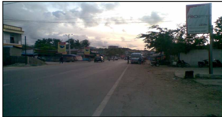
Gambar 5. Segmen Akhir Jalan Timor Raya KM 08+000