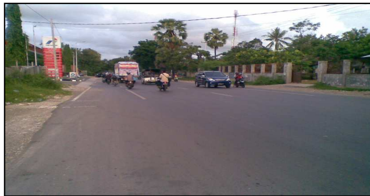
Gambar 4. Segmen Awal Jalan Timor Raya KM 08+000