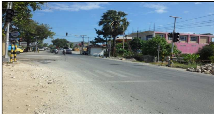
Gambar 3. Segmen Awal Jalan Timor Raya KM 07+000

Jalan Timor Raya KM 08 dimulai dari titik depan SPBU Oesapa dan berakhir di depan mini market Deltamart, dengan tata guna lahan campuran, yakni pertokoan/ kios, bengkel motor, rumah makan/ warung, bank, serta perumahan/ kos-kosan. Segmen awal dan akhir KM 07 dan KM 08 jalan Timor Raya dapat dilihat pada Gambar 3, 4 dan 5.