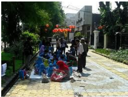
Gambar :04 Kondisi/ manfaat city walk

sepanjang segmen 3 dan 4. beberapa perbaikan masih perlu diperhatikan untuk keindahan city walk , seperti kebersihan pedestrian, kebersihan saluran drainase, serta pengalihfungsian city walk menjadi tempat parkir, city walk yang seharusnya nyaman bagi difabel dan nondifabel justru akan terganggu dengan hadirnya kendaraan bermotor roda dua yang melewati untuk menghindari kemacetan di jalan utama. Sebagai kota yang menjadi salah satu dari 10 kota terbaik di Indonesia, Solo mampu membuat sebuah ciri khas untuk kotanya, termasuk berkat kehadiran city walk ini. Tidak hanya dari segi budaya, namun dari segi fisik kota, seperti bertahannya bangunan lama dan bersejarah.