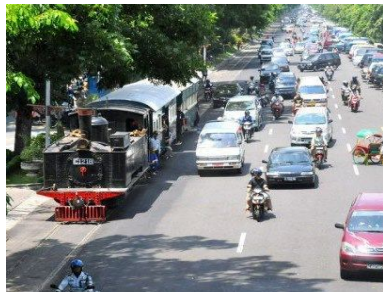
Gambar:06 Sarana Transportasi penunjang keberadaan City Walk