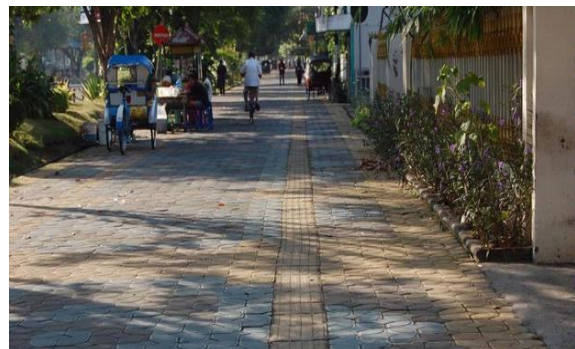
Gambar :03 Kondisi City Walk Jl. Slamet Riyadi Solo

kuliner. Segmen kedua, Brengosan-Gendengan, dilengkapi dengan wisata kuliner, pada segmen Gendengan-Stadion terdapat pusat perbelanjaan SGM (Solo Grand Mall). Sementara di segmen keempat, Stadion-Ngapeman, yang tergabung dengan fasilitas berupa stadion R. Maladi Sriwedari dan THR Sriwedari (Taman Hiburan Rakyat). Selain itu, ada Museum Radya Pustaka di segmen keempat city walk ini.