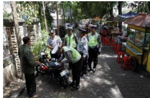
Gambar :05 Kondisi City Walk Jl. Slamet Riyadi Solo yang berubah fungsi menjadi area PKL