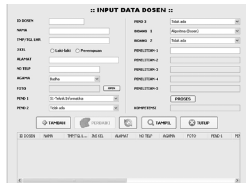
Gambar 6 Desain Interface Data Dosen

Tombol tambah, hapus, perbaikan, tampil, dan tutup memanfaatkan property text yang digunakan untuk memberi keterangan pada tombol, font untuk mengubah tampilan, serta icon untuk memberi gambar pada tombol. Event yang digunakan adalah actionPerfomed dan KeyPressed . Event actionPerfomed digunakan untuk menjalankan kode program saat tombol di eksekusi. Event KeyPressed digunakan untuk menuliskan kode program yang dijalankan dengan menekan keyboard. Untuk menampilkan data digunakan komponen tabel dengan property model untuk pengaturan nama kolom dan jumlah kolom.