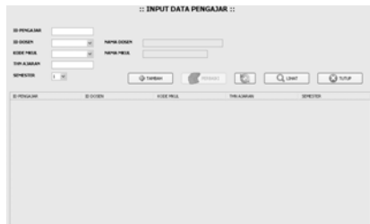
Gambar 7 Desain Interface Data Pengajar

Tombol tambah, perbaiki, tampil, dan tutup memanfaatkan property text yang digunakan untuk memberi keterangan pada tombol, font untuk mengubah tampilan, serta icon untuk memberi gambar pada tombol. Event yang digunakan adalah actionPerfomed dan KeyPressed . Event actionPerfomed digunakan untuk menjalankan kode program saat tombol di eksekusi. Event KeyPressed digunakan untuk menuliskan kode program yang dijalankan dengan menekan keyboard. Untuk menampilkan data digunakan komponen tabel dengan property model untuk pengaturan nama kolom dan jumlah kolom.