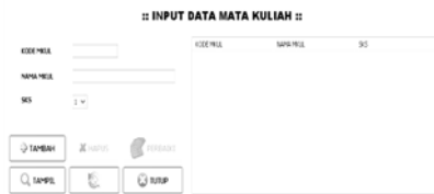
Gambar 5 Desain Interface Data Mata kuliah

Tombol masuk dan reset memanfaatkan property text yang digunakan untuk memberi keterangan pada tombol, font untuk mengubah tampilan, serta icon untuk memberi gambar pada tombol. Event yang digunakan adalah actionPerfomed . Event ini digunakan untuk menjalankan kode program saat tombol di eksekusi.